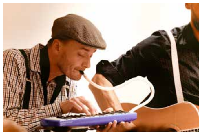
BosoBos v knihovně