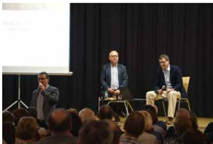
přednáška o historii Hlučínska