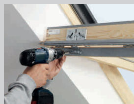
Výměnu těsnění, filtru a ventilační klapky