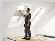
Montáž rolet a žaluzií