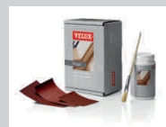
Repasí (broušení, lakování)