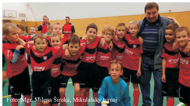
Mikulášský turnaj