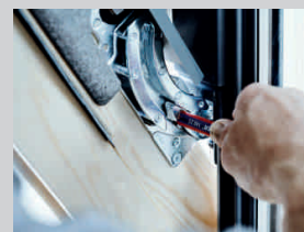
Promazání nebo výměnu okenních závěsů