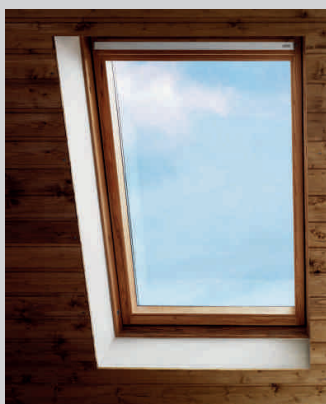
Výměna starého střešního okna za nové

Servisujeme, opravujeme, vyměníme střešní okna VELUX® . Nechte to na nás!