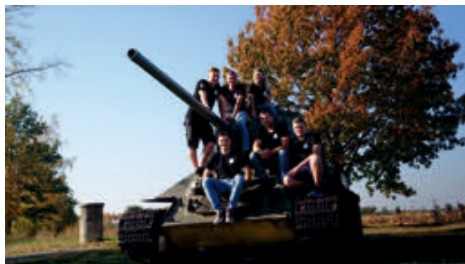
Organizátoři akce na společné fotografii.

Kromě hlavního programu, tedy rekonstrukce samotných bitev, byl k vidění i polní lazaret, tábory a vojenská technika jako například motorky, polní kanony, obrněný transportér, tank T-34 a premiéru si zde odbyl sovětský stíhací letoun Jakovlev Jak-3 .