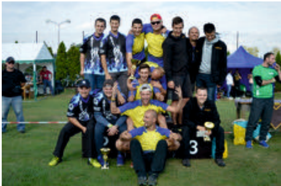
MSP v Komárově 26.8. - první místo