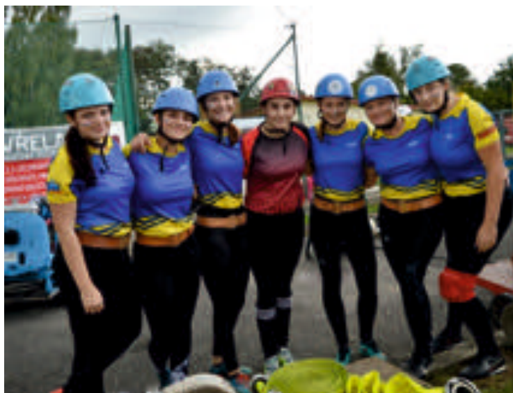
Závěrečné kolo v Neplachovicích 15.9.2018