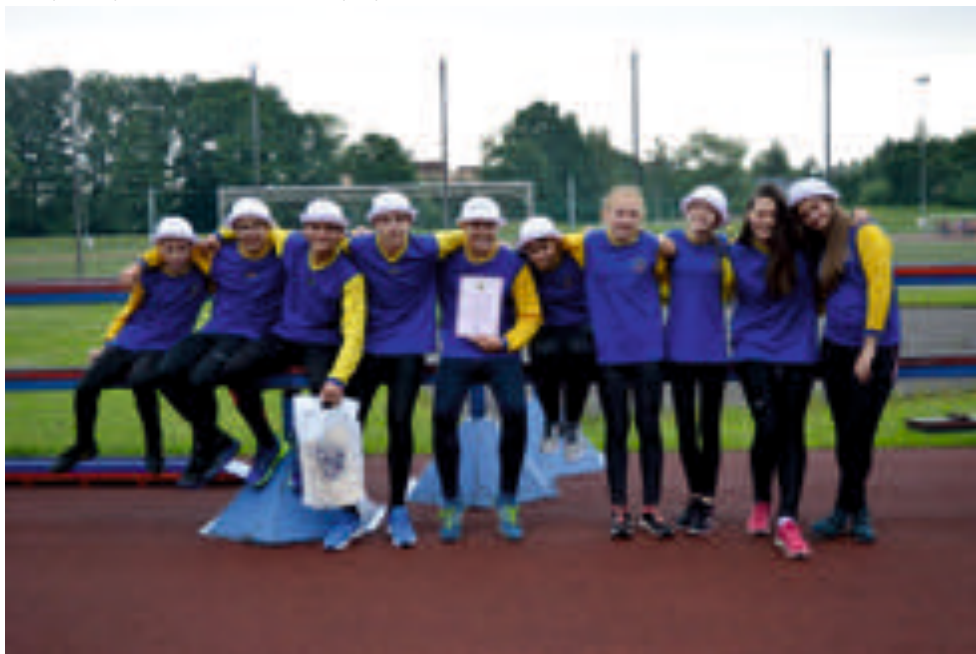
Krajské kolo hry Plamen 8.-9. 6. v Českém Těšíně

V sobotu 6. října se žáci zúčastnili ve Svobodě BRANNÉHO ZÁVODU . Starší družstvo získalo stříbrné medaile a mladší žáci obsadili 6. příčku. Všechny čeká malý oddech a potom krátká zimní příprava v tělocvičně.