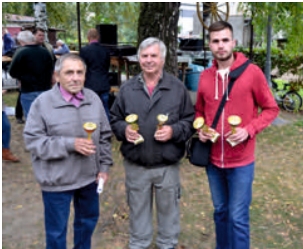
Slavnostní vyhlášení na X. Slezské a okresní výstavě v Hati.