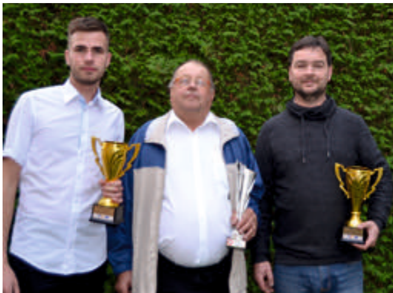
Členové po výstavě plemenných králíků v Zakrzówě.

Do konce roku budeme ještě vystavovat na evropské výstavě v Dánsku – Herning , na celostátní výstavě v Lysé nad Labem a na výstavě Moravia v Brně.