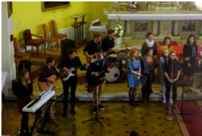
Koncert schol v Litultovicích, spodní obrázek Setkání v Chuchelné.

Chceme poděkovat všem, kteří navštěvují naše koncerty a vystoupení, podporují nás v tom, co děláme, a fandí nám.