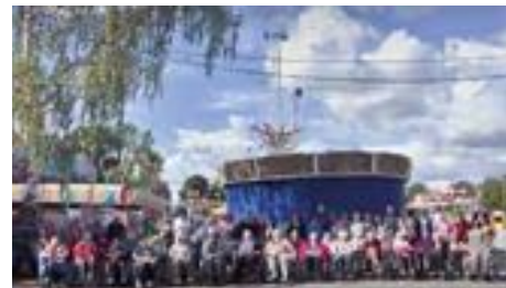
Vycházka na Mezivodky.

v Hradci nad Moravicí v prostorách hotelu Belaria a jeho okolí. Krásné a teplé počasí umocnilo zážitky z tohoto hezkého koncertu. V závěru měsíce jsme si připomenuli patrona naší farnosti sv. Bartoloměje a užili si velkolepý Odpust. Vycházka mezi kolotoče se uskutečnila tradičně v „odpus-