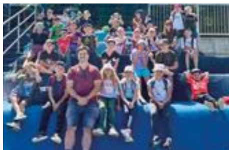
PT Sport camp.

V letošním roce připravili pedagogové Centra volného času Kravaře, spolu s externími vedoucími, pestrá nabídku příměstských, pobytových i stanových táborů, během nichž nechyběly výlety, tvořivé aktivity, hry ani nezapomenutelná dobrodružství. Děti si z deseti našich táborů odnesly nejen spoustu krásných zážitků, ale také nová