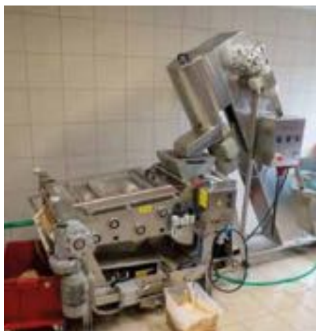
Nový moštovací lis PL500 v akci.

Zkušební provoz jsme zahájili při slavnostním otevření moštárny 27. 8. 2025 v 16:00 za přítomnosti zástupců města, farnosti a samozřejmě zahrádkářů. Zdaru tohoto velkého díla poželal otec Lukáš. Díky moc všem za podporu a především za brigádnickou činnost při přípravě moštárny. Ani se to nechce věřit, že nejen prázdniny, ale i léto nám pomalu končí. Pro zahrádkáře nastal čas sklizně. Drobné bobuloviny jsou už sklizeny, peckoviny, jádroviny a další ovoce sklizeň teprve čeká, takže na hodnocení si počkáme na našich výstavech.