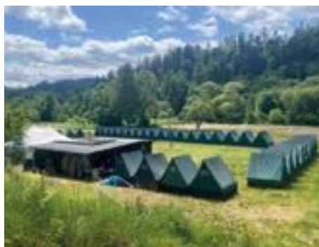
Táborová základna Hadinka u Klokočova.

V polovině srpna jsme se rozloučili také s naší táborovou základnou na Hadince u Klokočova. Do bourání stanové základny