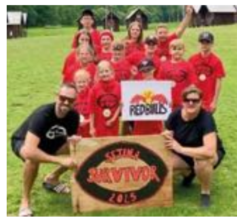
Pobytový tábor Setina.