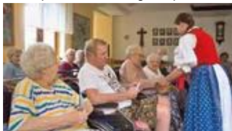
Posezení u cimbálu.

dili klienty do Zámecké kaple, kde nám otec Jakub sloužil mši svatou, při které jsme prosili za nás všechny – klienty, zaměstnance i naše rodiny. Pár dní na to jsme v Domově již tradičně přivítali soubor Kružberské pěnkavy, který nás přijíždí potěšit svým zpěvem pravidelně a naši klienti se vždy na toto sváteční odpoledne těší. A i tentokrát tomu nebylo jinak. Hezký a veselý koncert byl zakončen příjemným posezením u kávy a dobrého moučnicku. Následující akce proběhla opět venku, a to setkání našich klientů a zaměstnanců s klienty a zaměstnanci agentury DomA, se