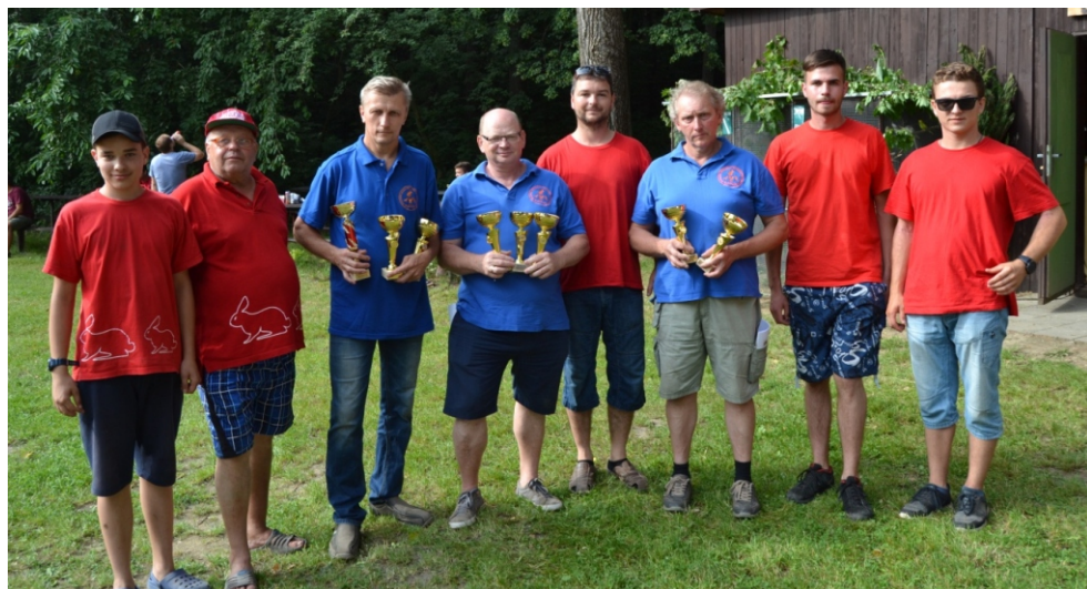
Výstavní výbor s polskými přáteli ZMDI Radlin.

Ve dnech 9. – 10. června se v areálu Pekliska konala Místní výstava drobného zvířectva a exotického ptactva . Této výstavy se zúčastnilo 74 vystavovatelů z okresu Opava, Bruntál a z polského Radlina. K vidění bylo 141 kusů králíků, 47 voliér drůbeže, 33 voliér holubů a 27 klecí exotického ptactva. I přes méně příznivé sobotní počasí výstavu navštívilo spousta návštěvníků, pro které bylo nachystáno občerstvení, reprodukováná hudba a pro děti skákací hrad. Děkujeme všem členům, příznivcům, vystavovatelům, sponzorům a Obecnímu úřadu Velké Hoštice za podporu a pomoc, bez které by výstava nebyla tak skvělá!