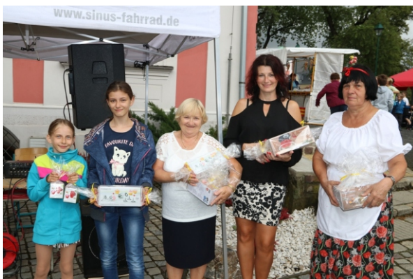
Vítězky buchtyády s cenami.

Úspěch zaznamenala taky oblíbená Buchtyáda, velice rozmanitých vzorků bylo tento rok 17, o umístění rozhodovala jak odborná porota, tak každý z návštěvníků. Ochutnávalo se ve velkém.