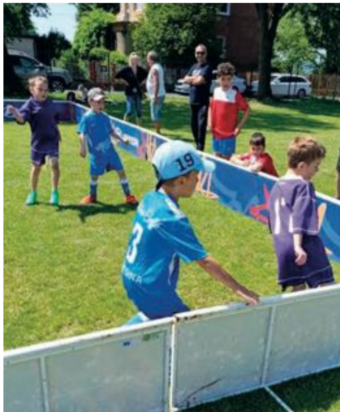
A tady několik fotek z halového turnaje ve Strahovicích