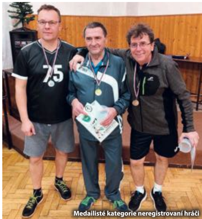
Medailisté kategorie neregistrovaní hráči