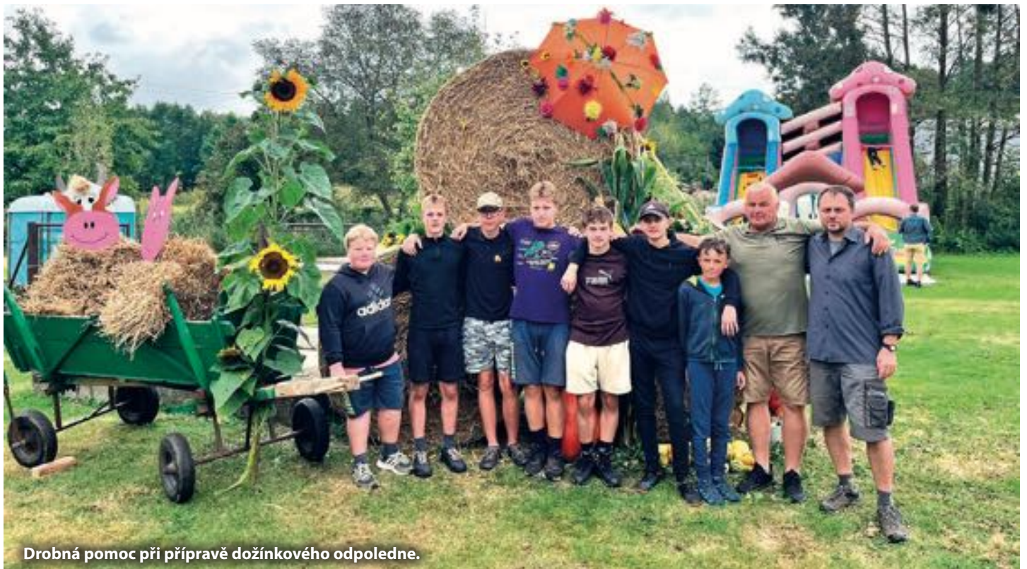
Drobná pomoc při přípravě dožínkového odpoledne.