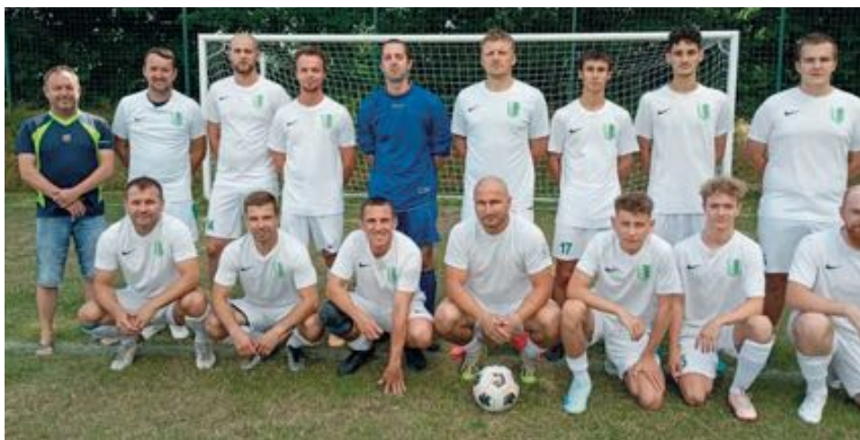
Družstvo mužů – soutěžní ročník 2025/2026

dežnických kategoriích v Kobeřicích nebo Oldřišově, ale zatím se nám je nepodařilo přesvědčit, aby hráli za Hněvošice. Budeme se snažit i nadále, snad se to povede, protože výsledky mužů nejsou dobré. Po podzimní části soutěže je mužstvo na 12. místě, získalo 10 bodů, když 3 utkání vyhrálo, 1 remizovalo a 8 utkání prohrálo a mělo pasivní skóre 15:39.