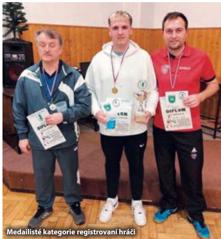
Medailisté kategorie registrovaní hráči

V tomto kalendářním roce 2025 budeme ještě na hřišti pořádat dvě akce. První bude v neděli 21.12.2025 od 13:30 hodin v tělocvičně na hřišti „Vánoční turnaj“ ve stolním tenise pro širokou veřejnost. I v tomto roce bude turnaj pro dvě kategorie hráčů, a to kategorii rekreační hráči -tzv. amatéři a druhá kategorie bude pro hráče, kteří hrají nějakou organizovanou soutěž v rámci okresu či kraje.