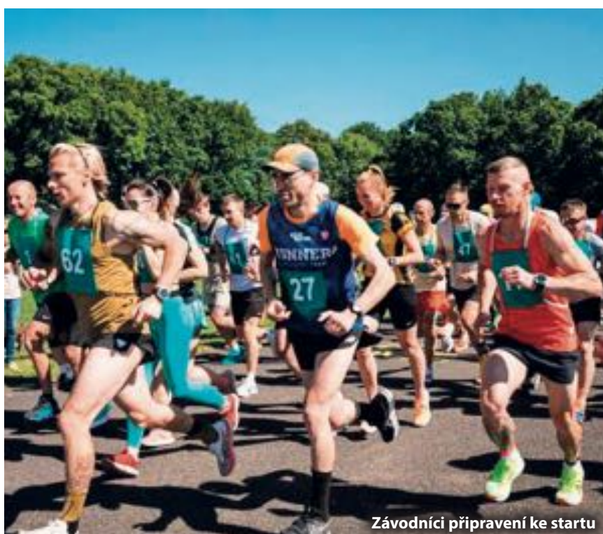
Závodníci připravení ke startu

Další „Hněvošická desítká“ bude poslední květnovou nedělí 31.5.2026. Všichni jste srdečně zváni.