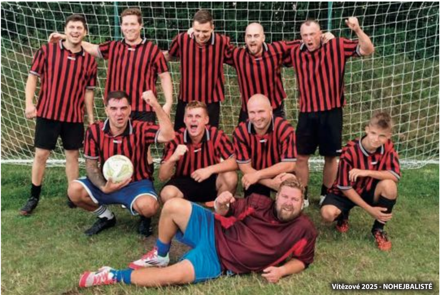
Vítězové 2025 - NOHEJBALISTÉ

Další akcí, která neodmyslitelně patří do prázdninového kalendáře na hřišti, je fotbalový turnaj v malé kopané. Turnaje se letos zúčastnilo pět mužstev. Hrál se systémem každý s každým. Fotbalové zápolení probíhalo celé sobotní odpoledne až do večerních hodin. Turnaj si užívají nejenom hráči jednotlivých mužstev, ale i děti rodičů, kteří fandili svým tatínkům. Letos turnaj ovládlo mužstvo s názvem „NOHEJBALISTÉ“, druhé bylo mužstvo s názvem „ALL STARS“ a třetí bylo družstvo „SMEČKA TEAM“. Obhájci prvenství se turnaje neúčastnili. Po ukončení turnaje bylo posezení u reprodukované hudby do pozdních večerních hodin. V příštím roce je turnaj naplánován na sobotu 1. srpna 2026.