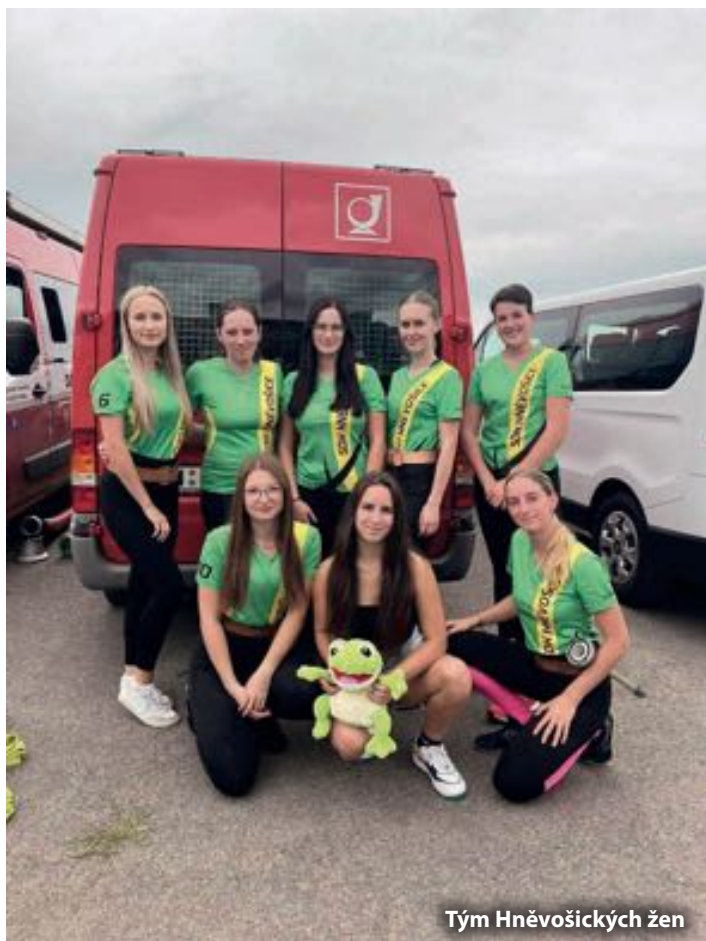
Tým Hněvošických žen