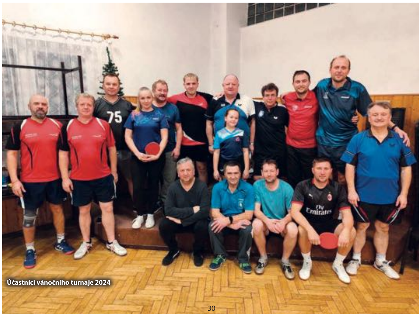
Účastníci vánočního turnaje 2024

Od listopadu se každé úterý v době od 17:00 do 19:00 hodin hraje v tělocvičně na hřišti stolní tenis. Je to určeno pro širokou veřejnost. Zahrát si může přijít každý, kdo má pátku a chuť se hýbat. Úterní hrací dny budou pravidelně až do konce března, kdy se opět rozběhne fotbalová sezóna.