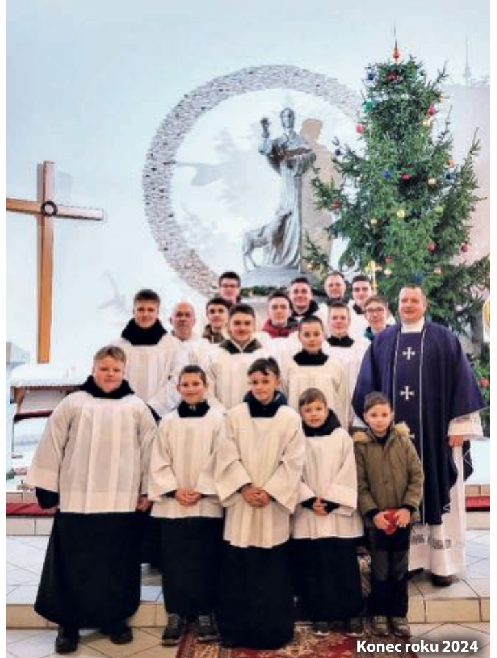
Konec roku 2024