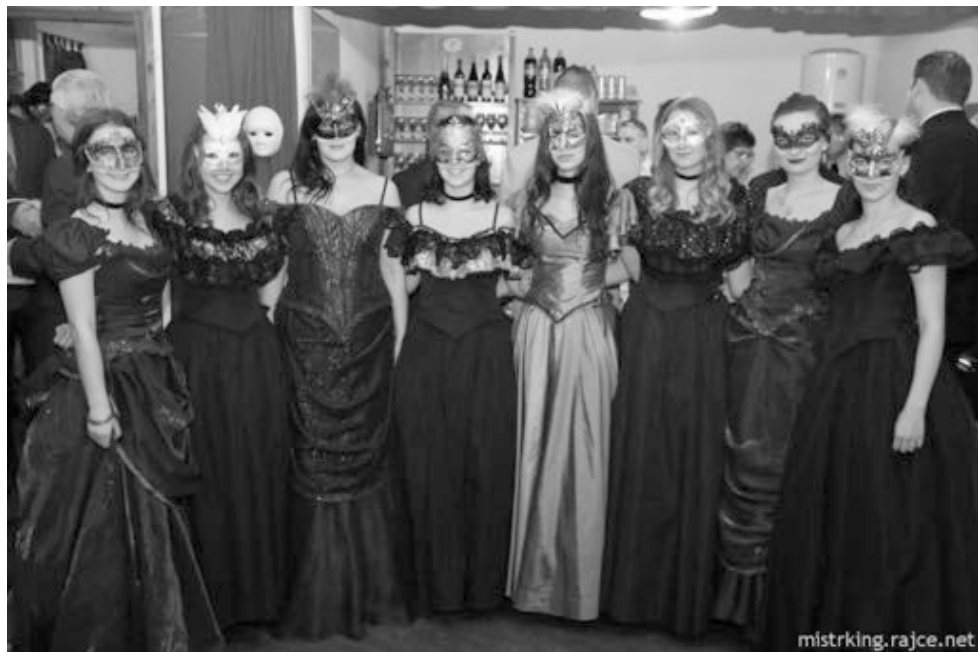
Devatero hostesky na obecním plese.

Čtvrtý rok v řadě jsme se zúčastnili našeho obecního plesu, tentokrát jsme kromě tance taky hráli a zpívali. Jelikož byly tématem plesu Benátky, zpívali jsme přímo na gondole italsky.