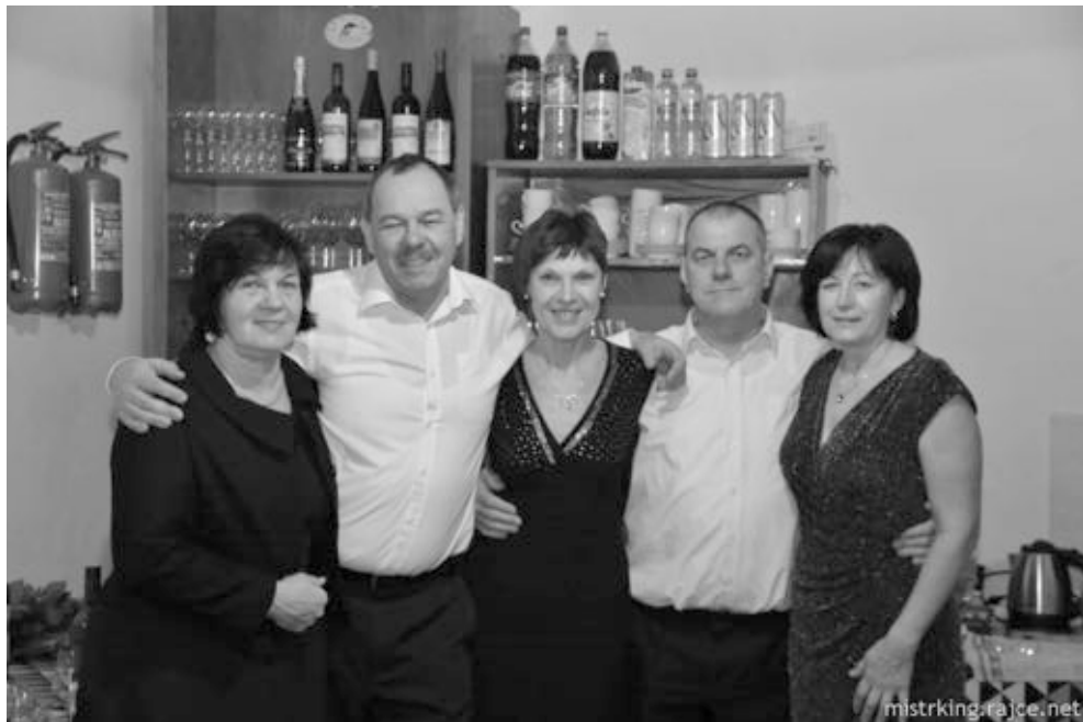
Perfektní osádka baru.

Velké díky těm, kteří se podíleli na přípravě, výzdobě i průběhu plesu, také sponzorům a v neposlední řadě účinkujícím. Že si dali tu práci s nacvičováním, aby zpřijemnilí návštěvníkům ples, a všichni tak mohli prožít velice pěkný večer.