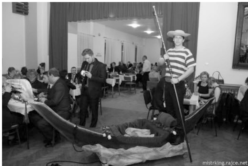
Gondoliér při projíždce.

Ples byl zahájen příjezdem gondoly s gondoliérem a zpívající lady. Zazněla píseň Santa Lucia a noblesní taneční páry spolku DEVATERO předvedly, jak se správně tančí na benátském plese.