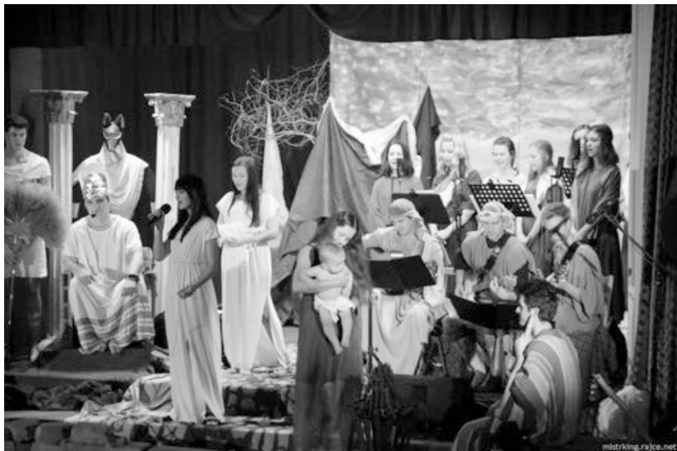
Z pásma Mojžíš.