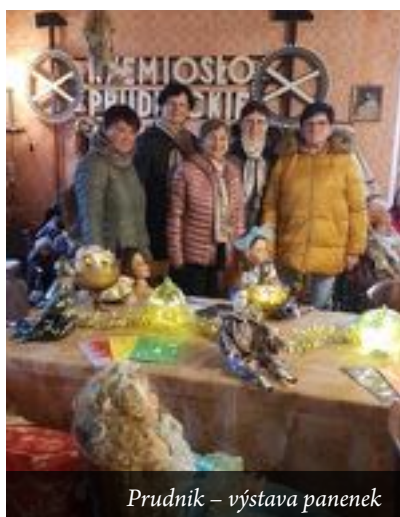
Prudnik – výstava panenek