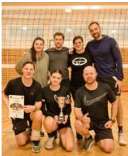
Vítězný tým turnaje

Dne 29. 11. 2025 se v tělocvičně ZŠ Velké Hoštice uskutečnil další ročník obecního volejbalového turnaje. V letošním roce se přihlásilo celkem 5 týmů. Hrál se systémem každý s každým. O postupu rozhodoval počet bodů a po velice vyrovnaném skóre