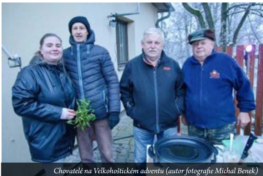
Chovatelé na Velkohoštickém adventu