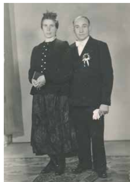
Svatební foto 1948