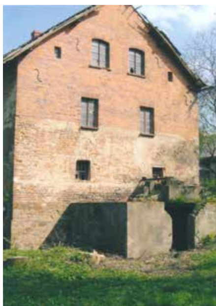
Mlýn, současný stav