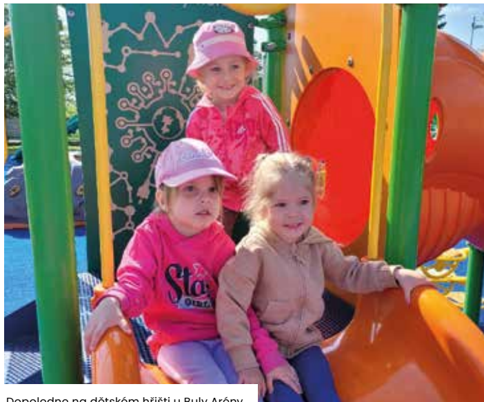
Dopoledne na dětském hřišti u Buly Arény