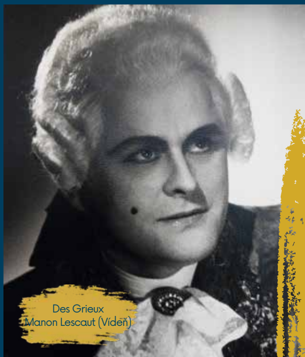
Des Grieux Manon Lescaut (Víděň)

V roce 1956 dostal nabídku hostovat ve Vídeňské státní opeře . Náročný záskok v titulní roli Verdiho Dona Carlose během pouhých dvou týdnů zvládl s mimořádným úspěchem. Právě Vídeň se stala branou k dalším světovým scénám.