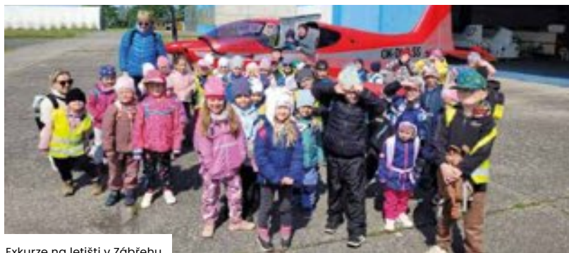
Exkurze na letišti v Zábřehu