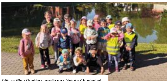
Děti ze třídy Sluníčko vyrazily na výlet do Chuchelné