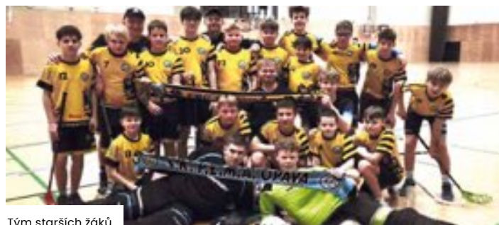
Tým starších žáků