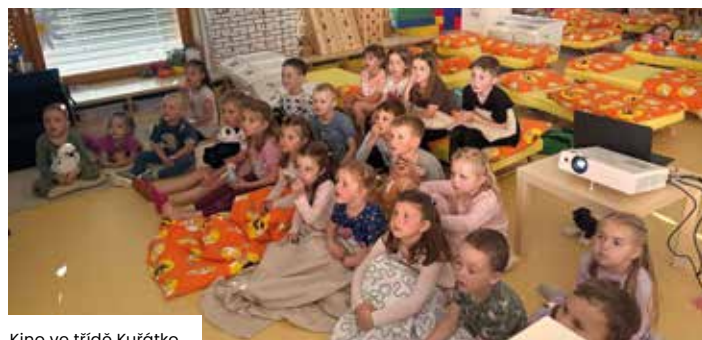
Kino ve třídě Kuřátko