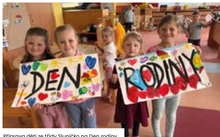
Příprava dětí ze třídy Sluníčko na Den rodiny