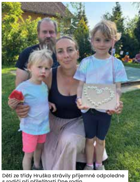
Děti ze třídy Hruška strávily příjemné odpoledne s rodiči při příležitosti Dne rodin