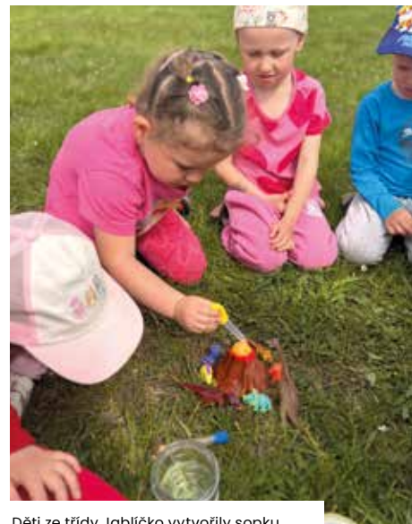
Děti ze třídy Jablíčko vytvořily sopku