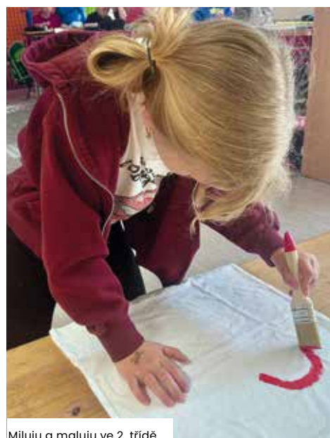
Miluju a maluju ve 2. třídě