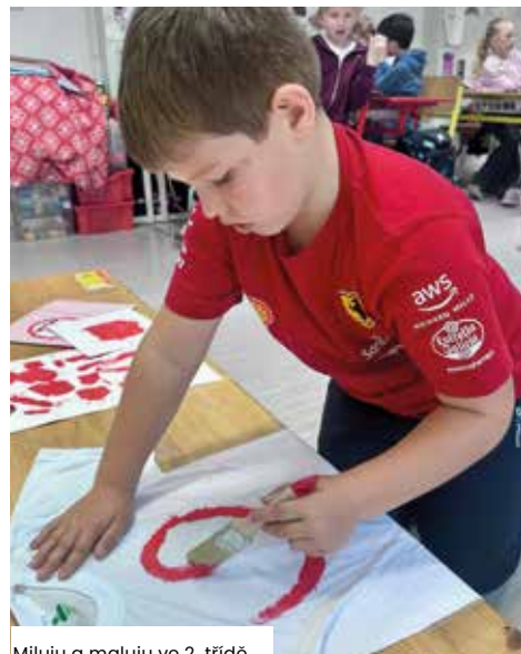
Miluju a maluju ve 2. třídě