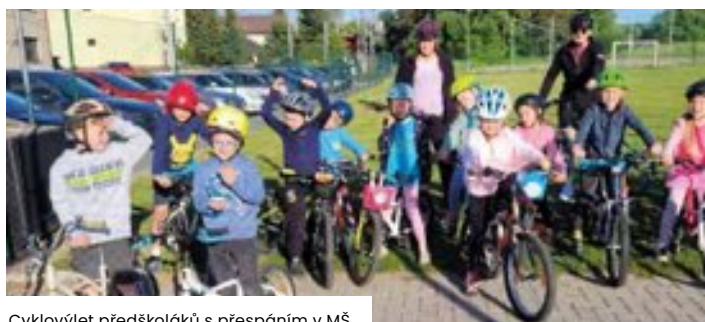
Cyklovýlet předškoláků s přespaním v MŠ