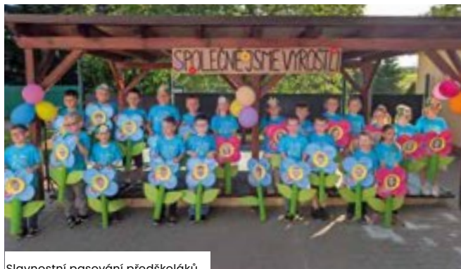
Slavnostní pasování předškoláků