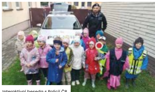
Interaktivní beseda s Policií ČR