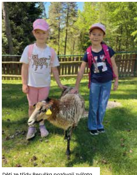
Děti ze třídy Beruška pozývají zvířata