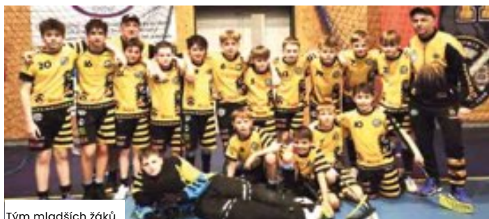
Tým mladších žáků