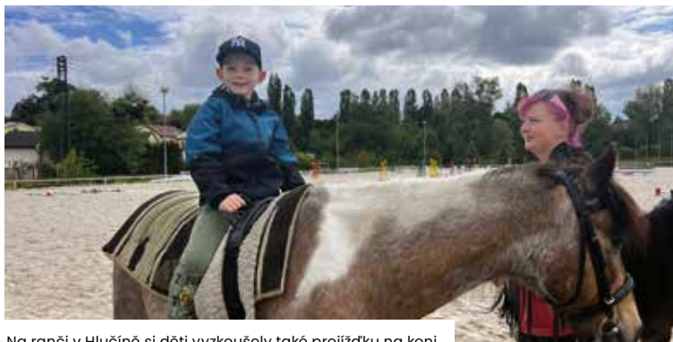
Na ranči v Hlučíně si děti vyzkoušely také projíždku na koni