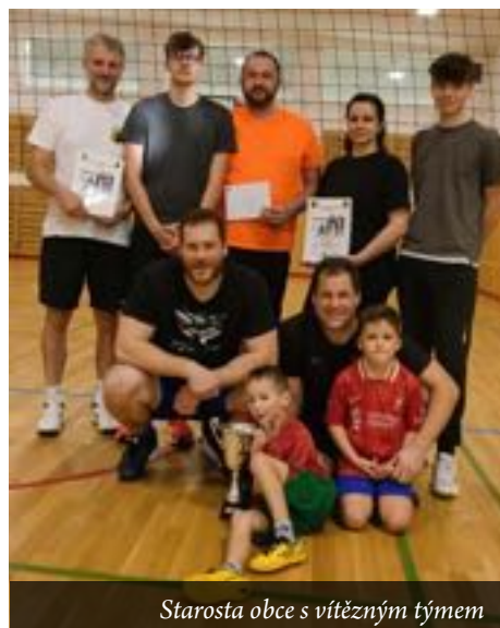
Starosta obce s vítězným týmem