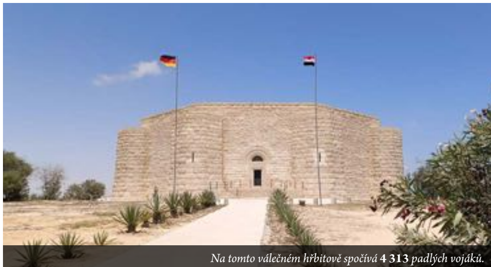
Na tomto válečném hřbitově spočívá 4 313 padlých vojáků.

Již v letech 1943 a 1947 pohřbívaly pohřební čtyři britské armády padlé vojáky Commonwealthu z roztroušených pouštních hrobů na nově vytvořeném hřbitově. Byli sem převezeni také italští a němečtí padlí. Výsledkem bylo provizorní pohřebiště s 3 000 padlými Němci a 1 800 padlými italskými vojáky. Na konci roku 1953 egyptská vláda povolila pracovní skupině německé komise pro válečné hroby, která byla předtím aktivní v Libyi, aby vyzvedla dalších 1 200 mrtvých těl ze zanedbaných hřbitovů a polních hrobů na svém území. Byli znovu pohřbeni v provizorním mauzoleu vedle hřbitova v Tell-el-Eyssa.