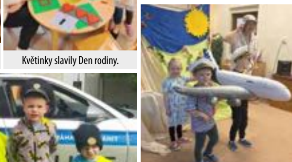
Děti ze třídy Kuřátko si užily divadelní představení Průzkumníci v Austrálii.