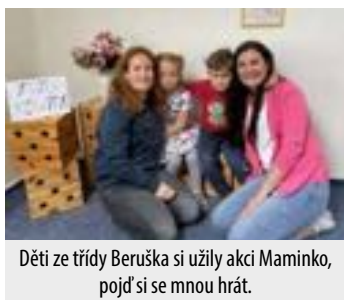
Děti ze třídy Beruška si užily akci Maminko, pojď si se mnou hrát.