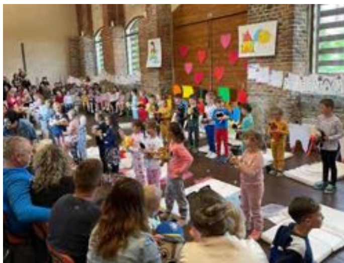
Den matek ve Farní stodole.