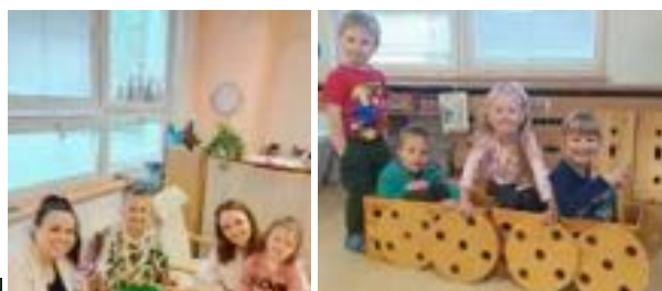
Květinčky slavily Den rodiny.