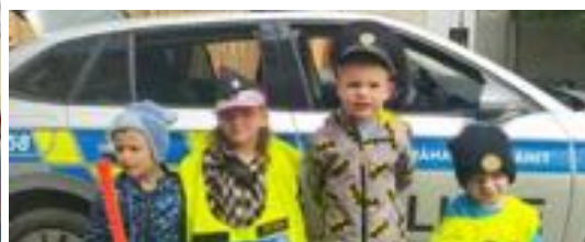
Prohlídka policejního auta - třída Jablíčko.