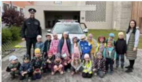
Děti ze třídy Kuřátko poznávají povolání - policie.