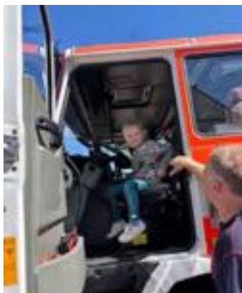
Děti ze třídy Kuřátko poznávají povolání - hasiči.