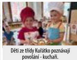
Děti ze třídy Kuřátko poznávají povolání - kuchaři.