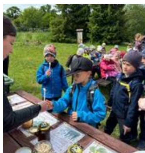
Včelí naučná stezka v Sosnové.