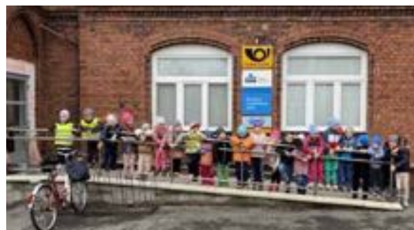
Děti ze třídy Sluníčko si povídaly o povolání a navštívily poštu.