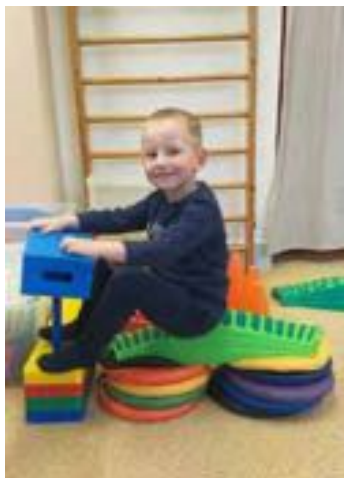
Cestujeme nejen lodí - třída Jablíčko.