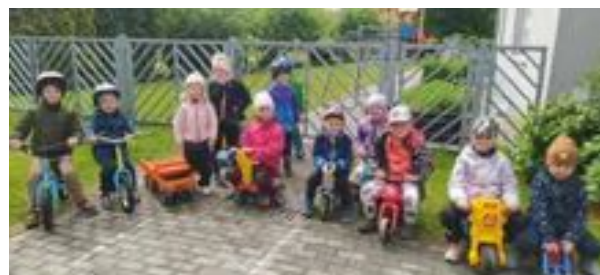
Cestujeme, čím se dá - třída Jablíčko.