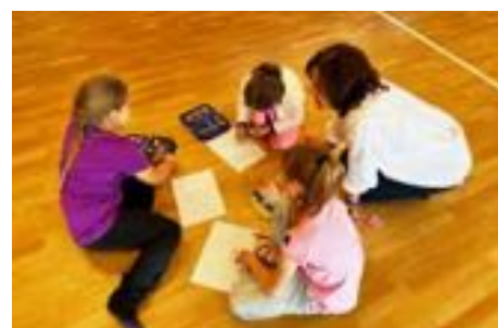
Hodina s paní psycholožkou v 1. třídě.