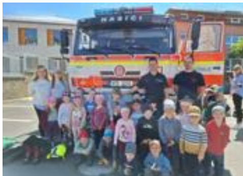
Den s hasiči - třída Květinka.