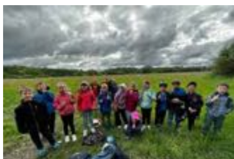
Výprava za pokladem – 1. třída.

školní povinnosti. V dopoledních hodinách se žáci učili matematiku a český jazyk, pracovali trochu jinou formou než ve škole. V pátek se celá třída vrátila domů.