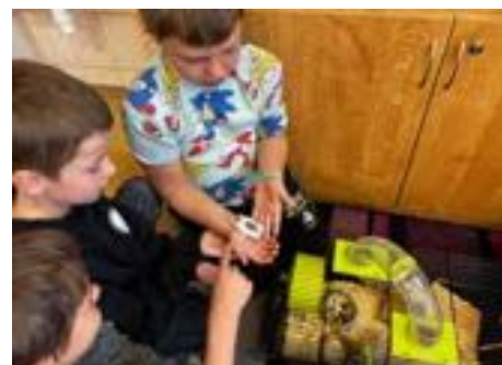
Den se zvířátky – 1. třída.