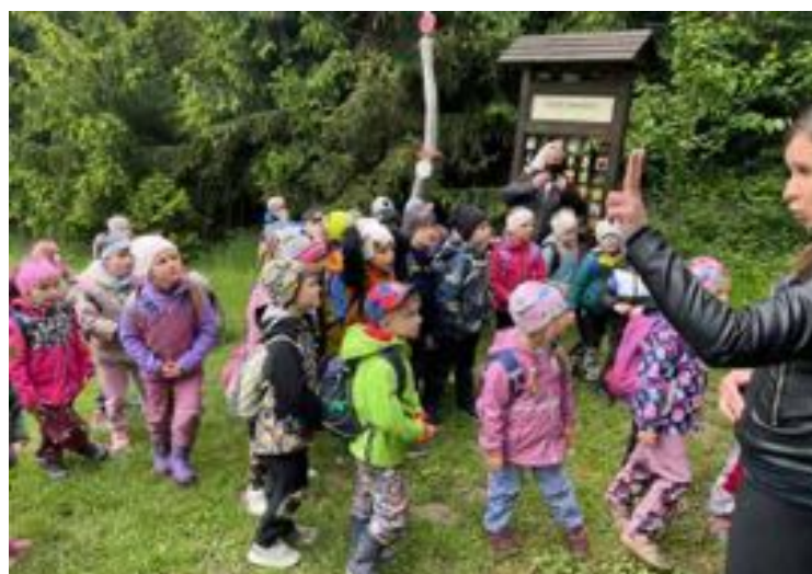
Včelí naučná stezka v Sosnové.