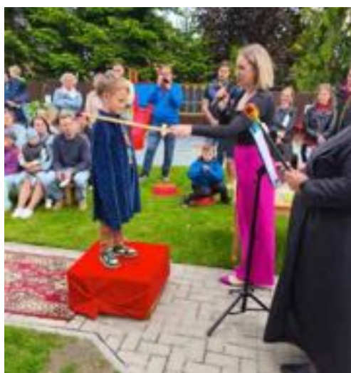
Slavnostní pasování předškoláků.