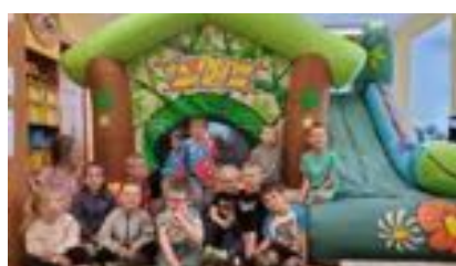
Oslava dne dětí.