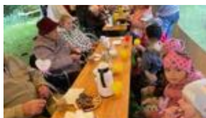
Mezigenerační setkání v klášteře.