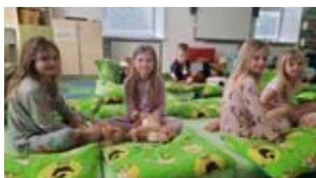
Přespaní předškoláků v MŠ po slavnostním pasování.