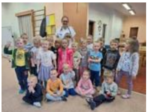
Beseda s paní doktorkou ve třídě Květinka.