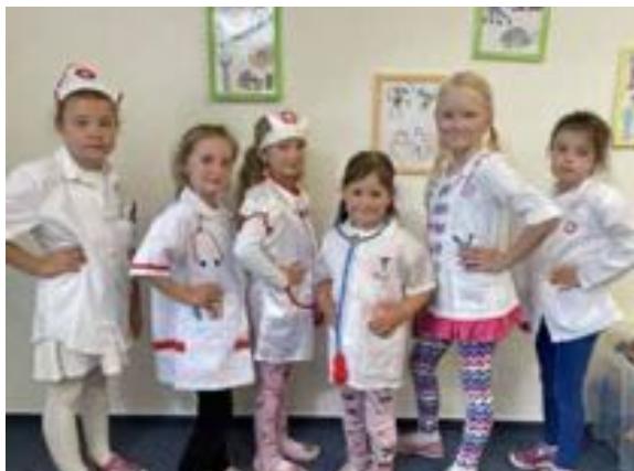
Poznáváme povolání - třída Beruška.