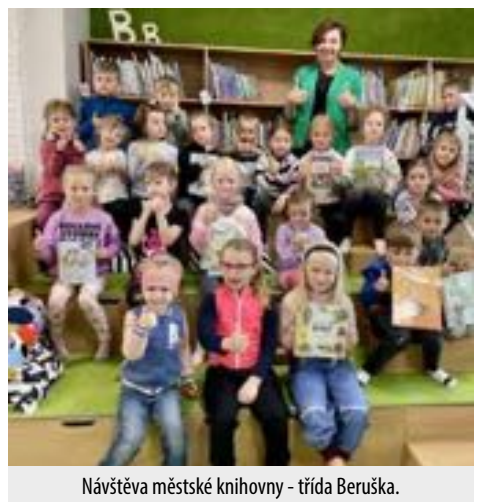
Návštěva městské knihovny - třída Beruška.