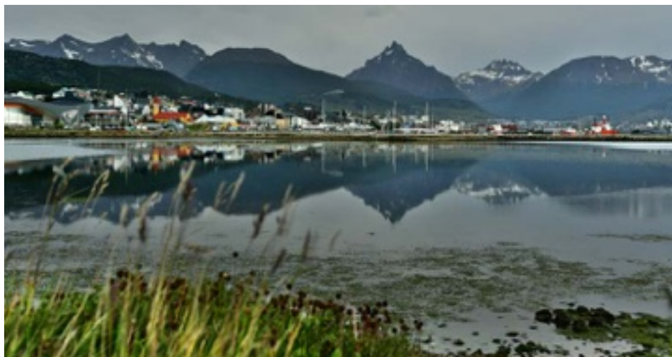
Ke konci 19. století byla Ushuaia jen poklidnou osadou. Velkým milníkem malé vesničky byl rok 1896, kdy se zde začala budovat trestanecká kolonie.

Než se tam dostaneme, musíme zvládnout celý Atlantský oceán od severu k jihu. Plavba byla naplánovaná na čtvrt roku se zastávkami