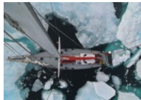
Když kapitán za kormidlem přestal mít dostatečný přehled o situaci před přídílí, vytáhl mě s vysílačkou na stěženi a já hlásil skulinky, kudy se ještě dalo proplout. Tady už však nebylo co hlásit.

Po třech dnech plavby se na obzoru vyhouply horské štíty Grónska. V chladných vodách se začínaly objevovat stále větší a větší ledové kry. Naše loď s desetimilimetrovým pláštěm trupu je konstruována i pro plavbu, kdy si musí prorážet cestu mezi krami. Po několika hodinách prodírání se mezi ledem jsme se dostali do míst, kde kry byly natolik nahuštěné, že už nebylo v silách našeho šestiválce je odtlačit. Proražená cesta za lodí se ihned zacelila a my se stali zajatci ledu. Nebylo zbytků než čekat, až se změní směr větru a proudů a ledové sevření povolí... Po dnu povolilo.