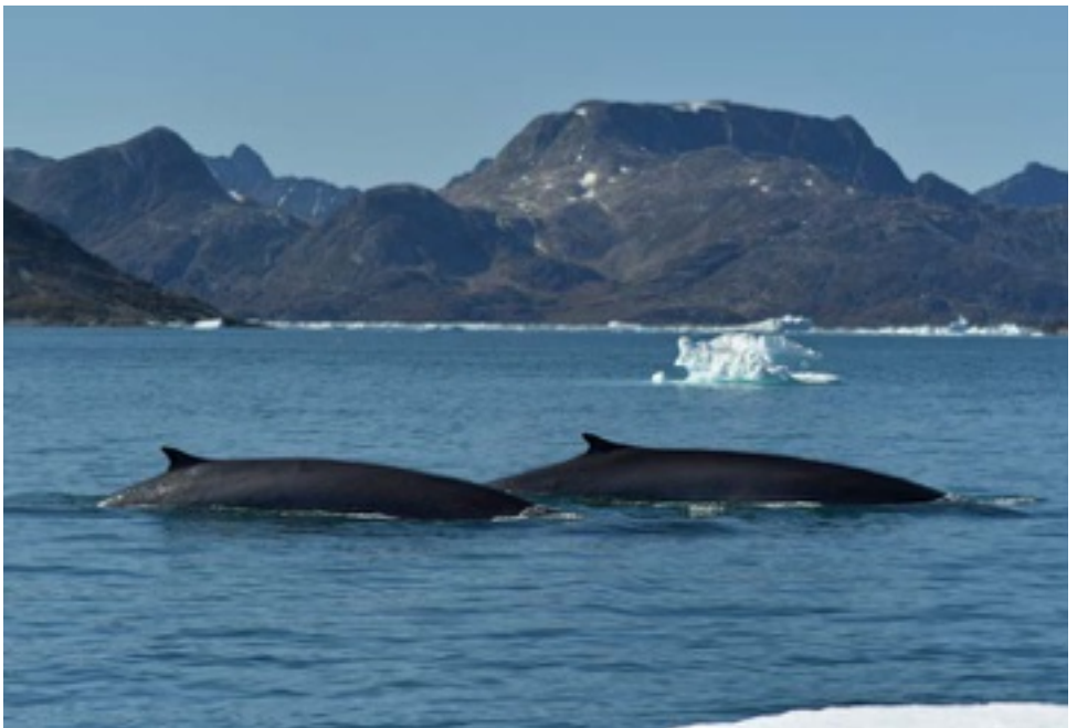
Nejčastěji pozorované velryby v Grónsku jsou plejtváci malí a keporkaci.