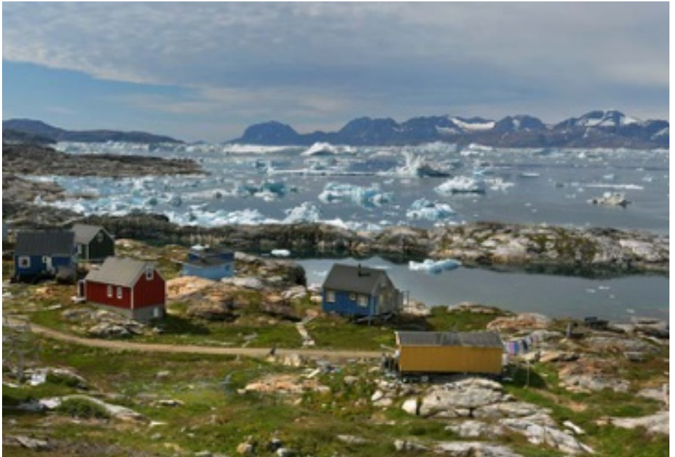
Tiniteqilaaq, malá osada na okraji ledovcového fjordu Sermilik, kde žije asi osmdesáticenná komunita lovců a rybářů.

Romanovy příspěvky a fotky z jeho cest jsou zveřejněny na facebookové stránce Cestou osudu a náhody.