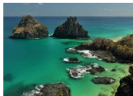
Po slavnostním překročení rovníku jsme spustili kotvu u malého brazilského klenotu Atlantiku, ostrova Fernando de Noronha.

Po zastávce na opuštěném ostrově St. Kilda na Vnějších Hebridách a návštěvě sopečných Vestmanských ostrovů jsme připluli