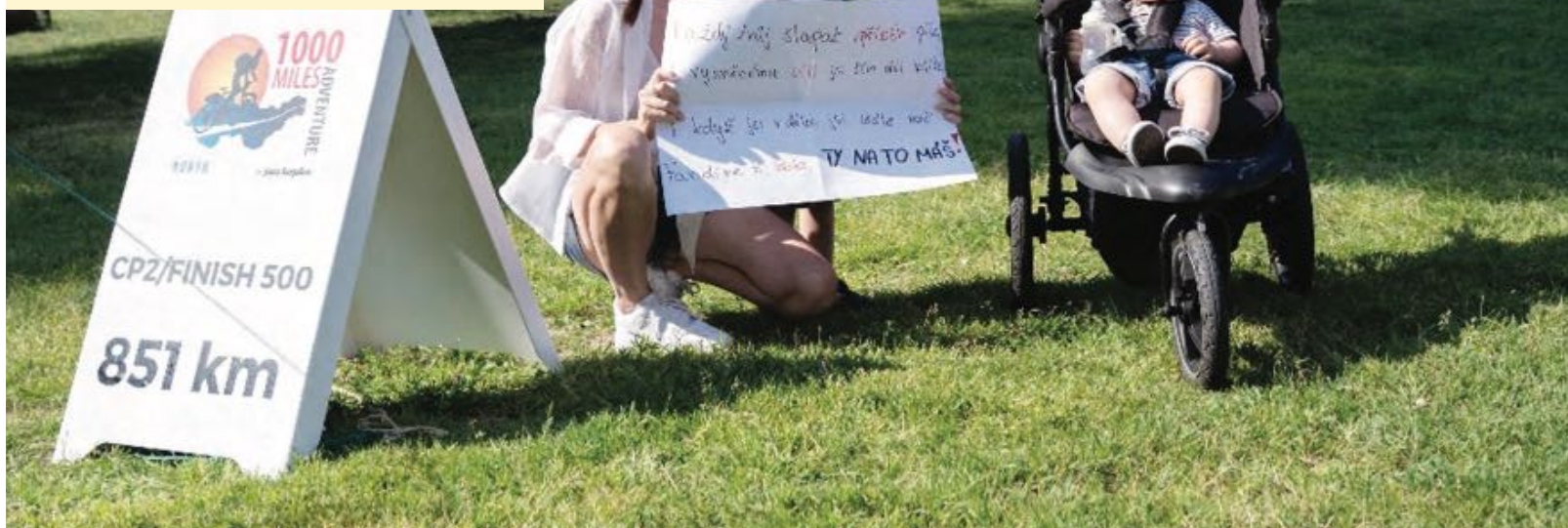
Velkou oporou byla pro Adama rodina

Bohdana Drastíková