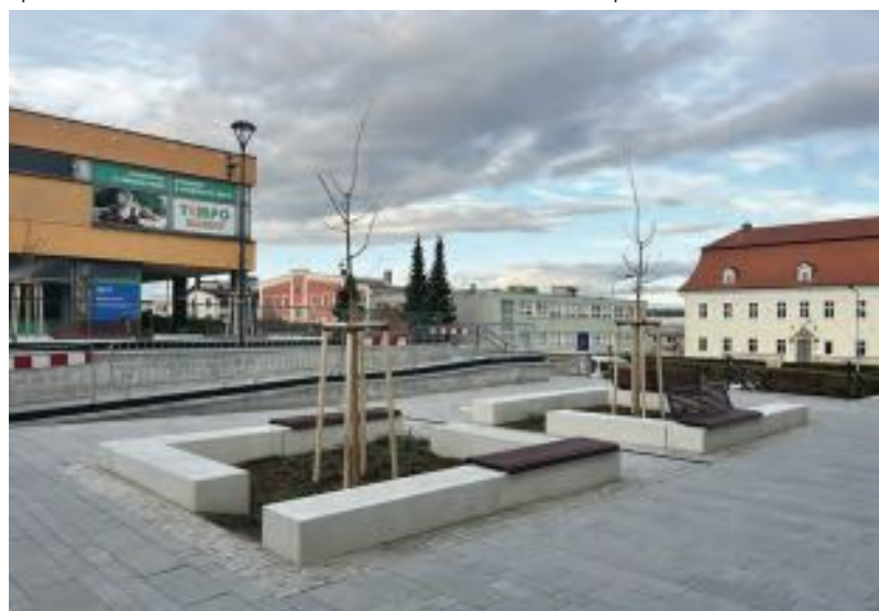
Revitalizace před DOS