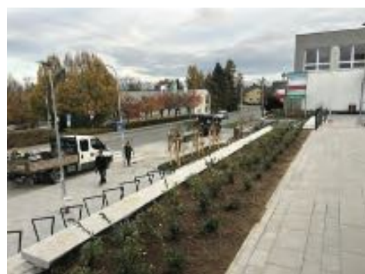
Revitalizace před DOS