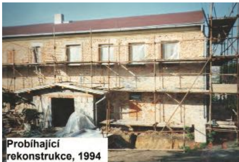
Probíhající rekonstrukce, 1994

V současnosti nabízí Turistická základna Vesmír ubytování až pro 38 osob v pěti ložnicích, moderně vybavenou kuchyň a jídelnu, místnost pro vedoucí a vnitřní hernu. Na přilehlé zahradě