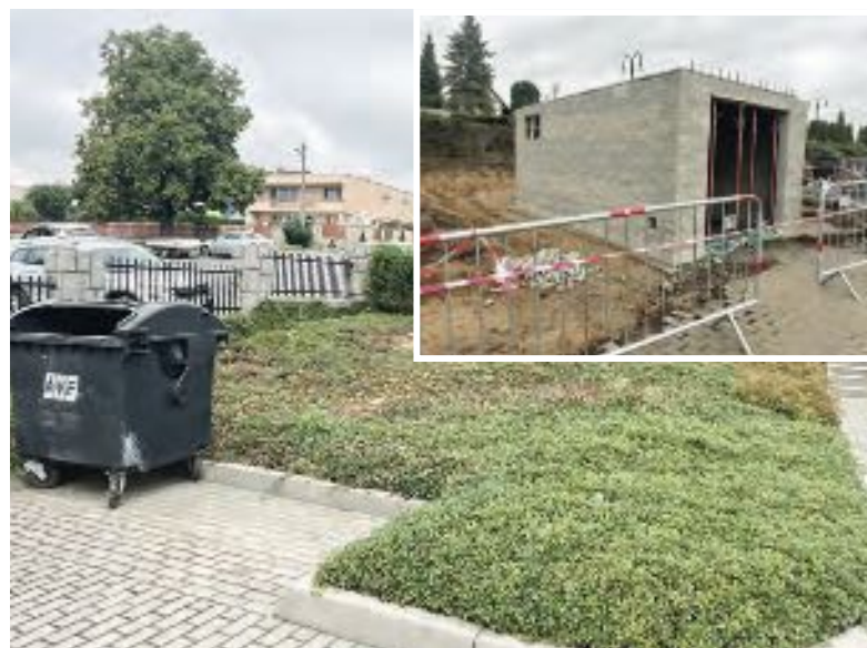
Zázemí na hřbitově