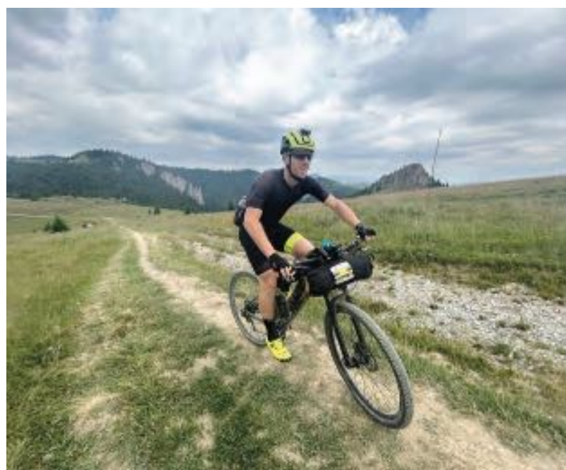
Náročný cyklistický závod vedl napříč Českou a Slovenskou republikou