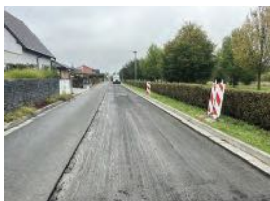
Oprava ul. Severní