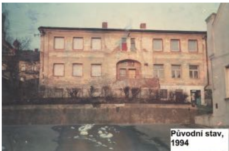
Původní stav, 1994