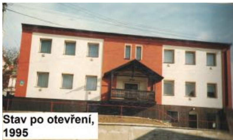
Stav po otevření, 1995