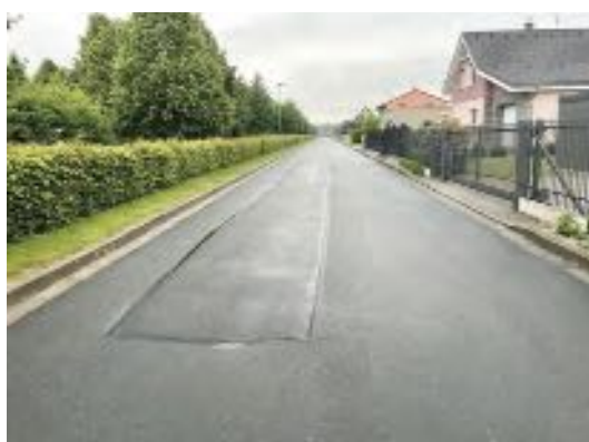
Oprava ul. Severní