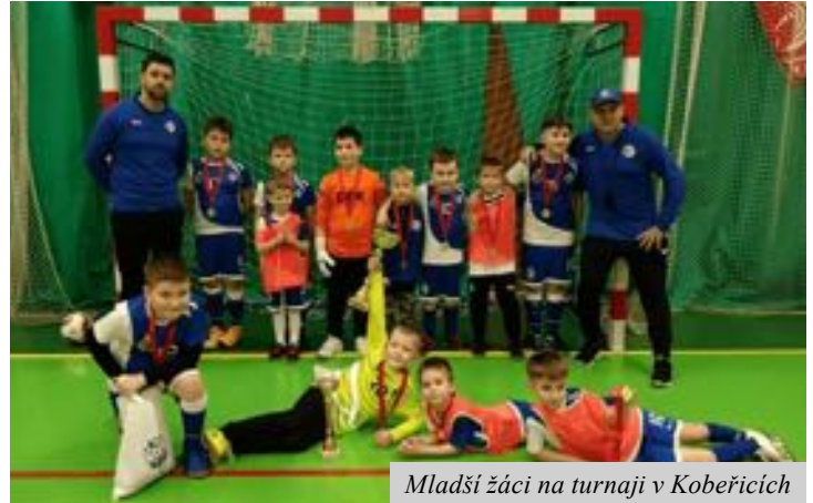
Mladší žáci na turnaji v Kobeřicích