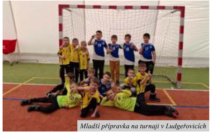
Mladší přípravka na turnaji v Ludgeřovicích