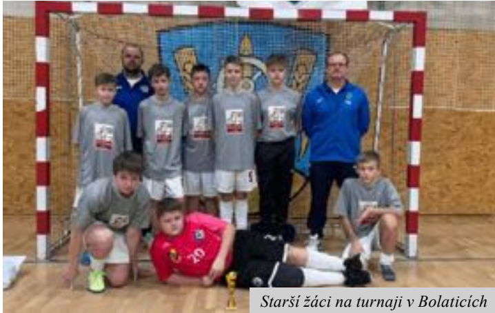
Starší žáci na turnaji v Bolaticích