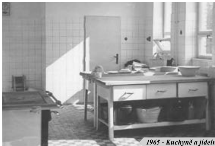
1965 - Kuchyně a jídelna / Dětská skupina - 2025