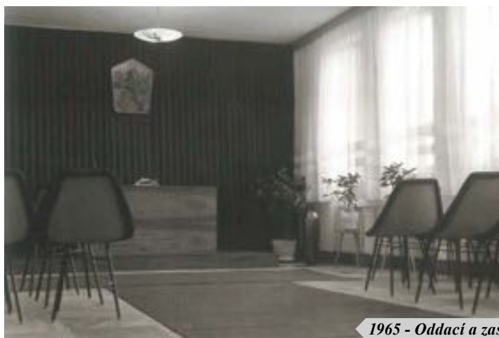
1965 - Oddací a zasedací miestnosť - 2025