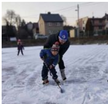
Zimní práce střediska služeb Příprava kluziště

Jabloňová alej v plném květu zdobí na jaře cestu vedoucí do naší vesnice. Kouzelná atmosféra probouzející se přírody zve k procházce.