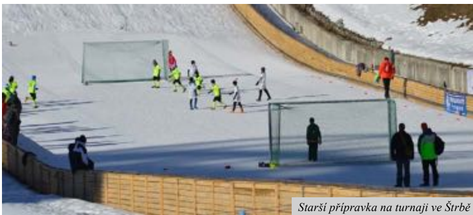
Starší příprava na turnaji ve Štrbě

„A“ mužstvo mělo zatím při uzávěrce zpravodaje (začátkem února) za sebou dvě přípravná utkání, které odehrálo na umělé trávě v Chlebičově. Prvním soupeřem našemu mužstvu byly Velké Hoštice, které naši muži porazili 2:0 a druhým soupeřem byly Bohuslavice, které naši hráči také porazili, tentokrát 4:0.