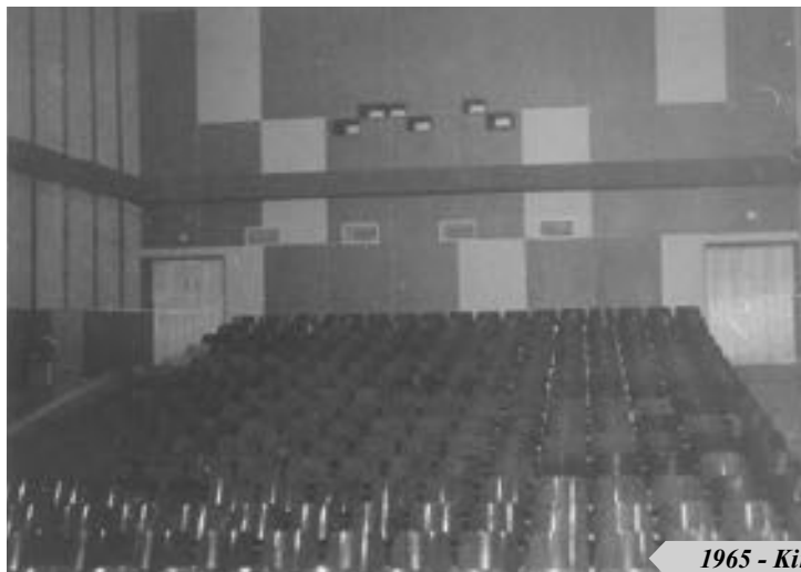
1965 - Kinosál - 2025