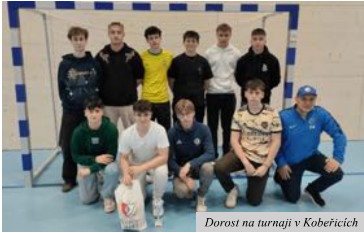
Dorost na turnaji v Kobeřicích