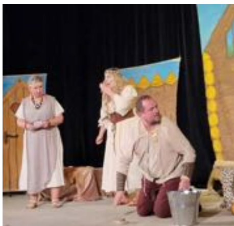
ŠOS oslavil desetileté výročí Dívčí válkou