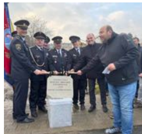
Poklepání základního kamene nové hasičské zbrojnice