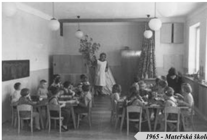
1965 - Mateřská školka / Zrcadlový sál - 2025