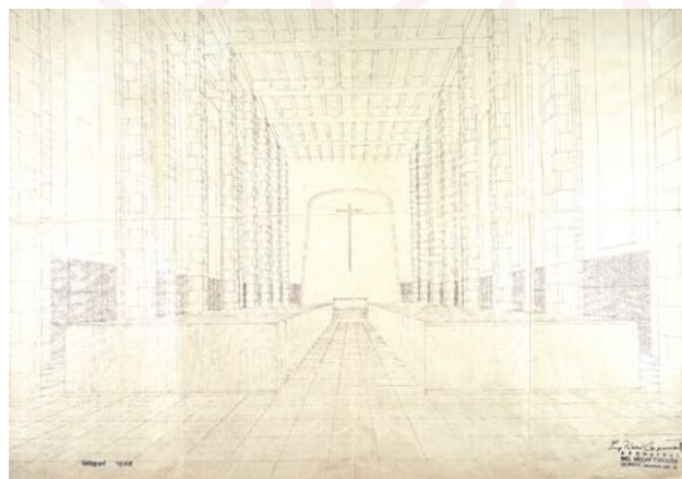
Návrh interiéru nového kostela z roku 1948