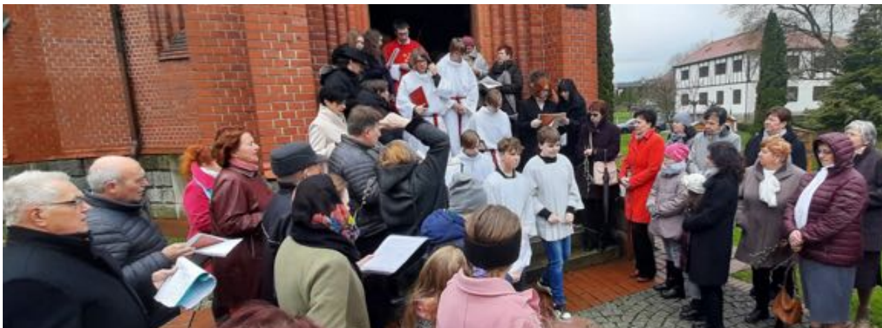
Květná neděle 2024

Velikonoční doba nekončí pro křesťany vzkříšením, ale pokračuje velikonočním oktávem, a pokračuje ještě sedm týdnů. Po čtyřiceti dnech od Velikonoc se slaví Nanebevstoupení páně a následující neděle dobu velikonoční ukončuje. Po deseti dnech slaví křesťané Soslání ducha svatého a za sedm dní pak svátek Nejsvětější Trojice. Čtvrtý den od tohoto svátku se slaví svátek Těla a Krve Páně – Boží Tělo. Všechny tyto svátky naši předkové