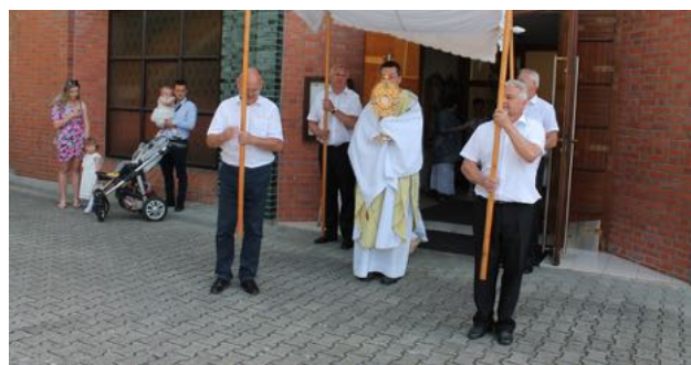
Boží tělo 2022