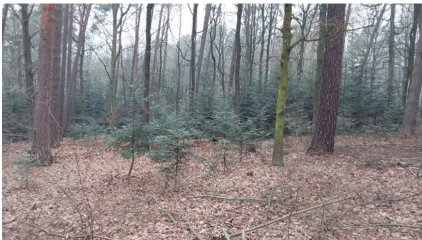
Úspěšná obnova jedle pod porostem

Lesnictví v České republice je jedním z oborů, bez kterého se v kulturní krajině i národním hospodářství neobejdeme, pracuje s živým ekosystémem v aktuálně se měnícím klimatu a podstupuje spoustu aktuálních i budoucích výzev, tak aby naše lesní národní bohatství bylo chráněno, citlivě obhospodařováno, a především zachováno pro budoucí generace. I přes doznívající kůrovcovou kalamitu v Čechách se daří lesy rychle obnovovat a lesnatost ČR se neustále mírně zvyšuje, aktuálně přes 34 % výměry ČR pokrývají lesy. Během covidové pandemie výrazně vzrostl zájem veřejnosti o pohybové aktivity v lesích a začaly více času věnovat pobytu v přírodě a přirozeně je zajímavé co se kde a jak děje, proto přinášíme několik základních informací o hospodaření v lesích obklopujících naše obce.