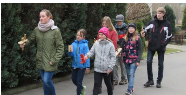
Klekotání na Restě 2018

zem baldachýn. V padesátých letech minulého století byl vládou komunistů vydán zákaz průvod Božího Těla připravovat. Museli jsme se spokojit s tím, že se celá slavnost uskutečnila jen v kostele. Aspoň zelené břízky v presbytáři nám ji připomínaly. Dnes se může průvod uskutečnit, ale bohužel, děvčátek s květinami je málo a průvod věřících je také poněkud menší. Budme rádi, že ti, co chtějí uctít Tělo a Krev Kristovu, to mohou bez obav udělat. Tra-