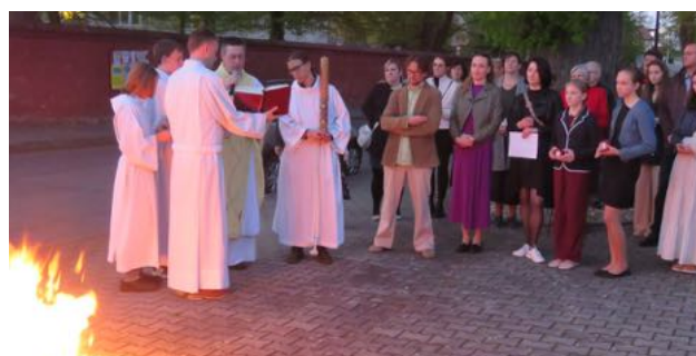
Bílá sobota 2025

světli. Oslava Božího těla byla vždy velkou událostí pro celou vesnici. Už den předem, nebo brzy ráno maminky spěchaly do zahrady i na louku, aby nasbíraly a natrhaly okvětní lístky pro své dcerky. Ty pečlivě vložily do papírových, nebo plátěných sáčků nebo tašek. Děvčata ustrojily do pěkných, nejlépe bílých šatiček, na hlavu jim upevnily myrtový, nebo grušpanový (zimostráz) věneček, do ruky dostaly proutěný košíček a šlo se do kostela. Po mši svaté se všichni seřadili a v průvodu vyšli do ulic obce. První šla děvčátka a sypala na cestu květiny, za nimi šli ministranti, pak pan farář s monstrancí, ve které je uložena Nejsvětější svátost. Čtyři muži v bílých rukavičkách nesli nad kně-