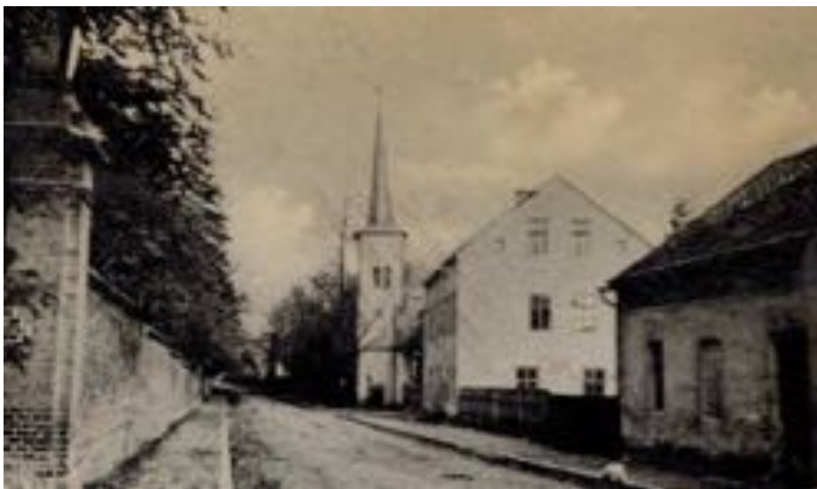
Kostel na ulici Náměstí 8. října

Žádost o výstavbu první církevní stavby v obci podal u olomoucké konzistoře hrabě František Bernard Lichnovský dne 5. května 1727. Bylo to odůvodněno tím, že farní kostel v Krzanowicích je vzdálen od jeho obydlí cca 4 km, on má přes 60 roků a síly mu ubývají. Chce tímto u svého obydlí v Chuchelné zřídit kapli, kde by mu dvorský kaplan denně četl mše pro něho, jeho rodinu a služebnictvo. Žádosti bylo vyhověno a podle kanonických předpisů katolické církve bylo doprovázeno povolením ke čtení mší v kapli na dobu 7 let. Kaple byla ještě v témže roce postavena v areálu zámku. V roce 1734 došlo k prodloužení povolení ke čtení mší v chuchelenské zámecké kapli na dalších sedm let. Povolení platilo pro rodinu hraběte Lichnovského, jeho šlechtické hosty a služebnictvo. Při dalších prodlouženích bylo povolení doplněno i pro úředníky správy panství a jejich služebníky v době nepřítomnosti pána.