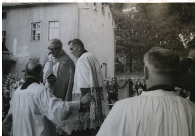
Svěcení základního kamene nového kostela 26. 6. 1969