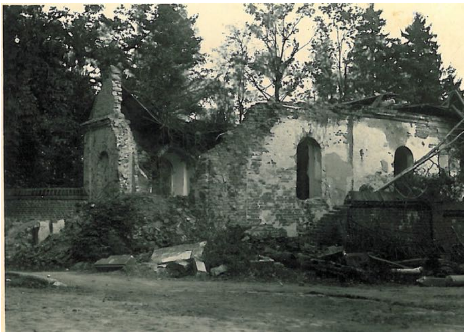
Trosky vybombardovaného kostela z 31. 3. 1945