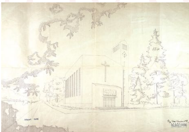
Návrh stavby nového kostela z roku 1948