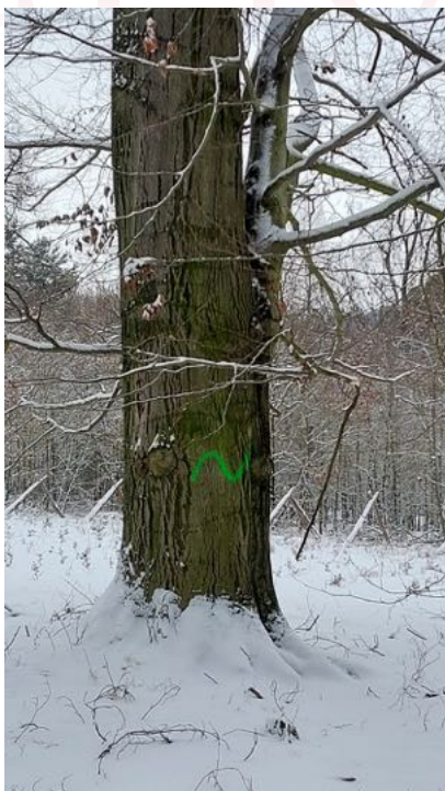
Označený biotopový strom

celoročně pak probíhala průběžná údržba lesní dopravní sítě včetně tradičního mulčování krajnic v letním období, na podzim byla odstraněna vrstva humusu na krajnicích asfaltových cest, během roku také byly doplněny zákazové značky na přístupových cestách do lesů, taktéž jsme uklidili několik historických černých skládek odpadu. Ve spolupráci s obcí Bolatice jsme také revitalizovali cestu