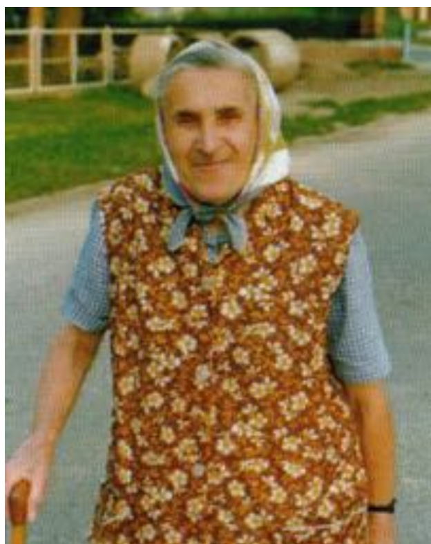
Kostelnice tětka Mika