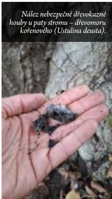
Nález nebezpečné dřevokazné houby u paty stromu – dřevomoru kořenového ( Ustilina deusta ).

Navrhované technologické postupy vždy odpovídají standardizovaným opatřením z metodik Agentury ochrany přírody a krajiny ČR (AOPK) a spočívají především v řezech stromů, vazbách jejich korun či v krajním případě kácení. Při provádění inventarizace byl kladen důraz na to, aby byly reflektovány podmínky zdejšího prostředí a jeho problémy. Zvláštní pozornost proto byla věnována kalamitnímu napadení stromů jmelím či skutečnosti, že územím před nedávnou dobou prošla významná po-