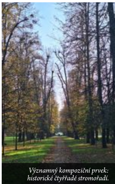
Významný kompoziční prvek: historické čtyřřadé stromořadí.

Během loňského října byla v části zámeckého parku Velkých Hoštic zpracována inventarizace dřevin. Tato práce prováděná arboristou spočívá v komplexním hodnocení stavu stromů, zjištění jejich druhů a rozměrů a vypracování podrobné zprávy a mapy s pozicemi jednotlivých prvků – stromů a keřů. U stromů je zjišťován jejich zdravotní stav, totiž různá růstová a mechanická poškození či napadení dalšími druhy organismů. Spolu s určením vitality stromů je pak u konkrétních jedinců