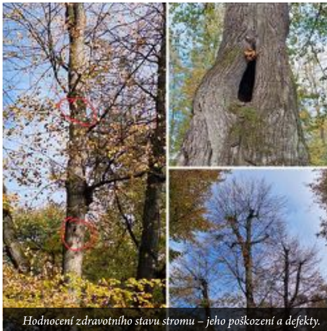
Hodnocení zdravotního stavu stromu – jeho poškození a defekty.

vodeň (září 2024). Zásadním aspektem při hodnocení byla také historická hodnota kompozice parku, obzvláště starého čtyřřadého stromořadí. V rámci návrhu opatření byly také stanoveny naléhavosti jejich provedení, jejich důležitosti. Takto zpracovaný dokument potom slouží při plánování údržby parku či jako podklad pro zpracování komplexního projektu revitalizace a při dalších projekčních činnostech. Obecným smyslem dokumentů tohoto typu je snaha o zajištění dlouhodobé perspektivy a obnovy daného území, za využití odpovídajících pěstebních opatření.