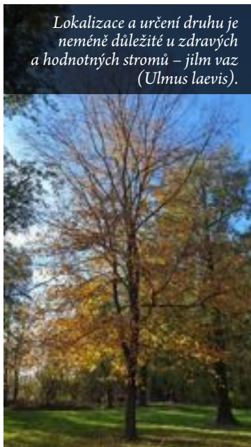
Lokalizace a určení druhu je neméně důležité u zdravých a hodnotných stromů – jilm vaz ( Ulmus laevis ).