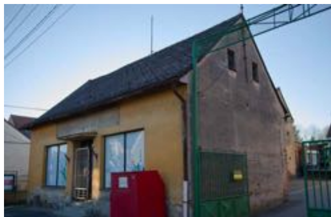
Bývalá průmyslovka – stávající stav – objekt určený k demolici

Realizací projektu dojde k celkovému urbanistickému oživení centrální části obce, odstranění nevyužívaných a technicky nevyhovujících objektů a vytvoření nového, kvalitního veřejného prostoru, který bude důstojně sloužit potřebám našich obyvatel. Součástí návr-