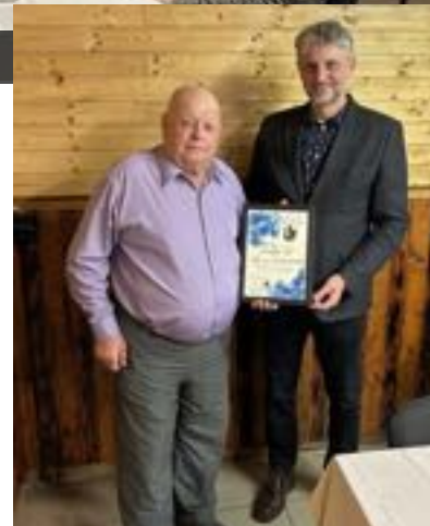
Předseda základní organizace přebírá Pamětní list z rukou starosty obce