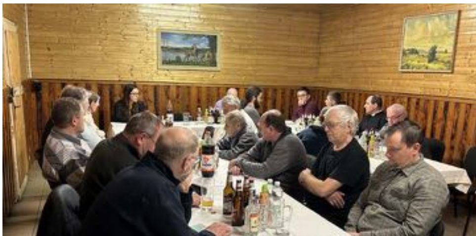
Průběh výroční členské schůze

Ve dnech 14.–15. 6. proběhne v areálu chovatelů Pekliska Místní výstava králíků, drůbeže, holubů a exotického ptactva. K vidění bude spousta zvířat v pestré paletě tradičních i netradičních plemen. V sobotu zahraje country kapela Karavana, která zpříjemní atmosféru