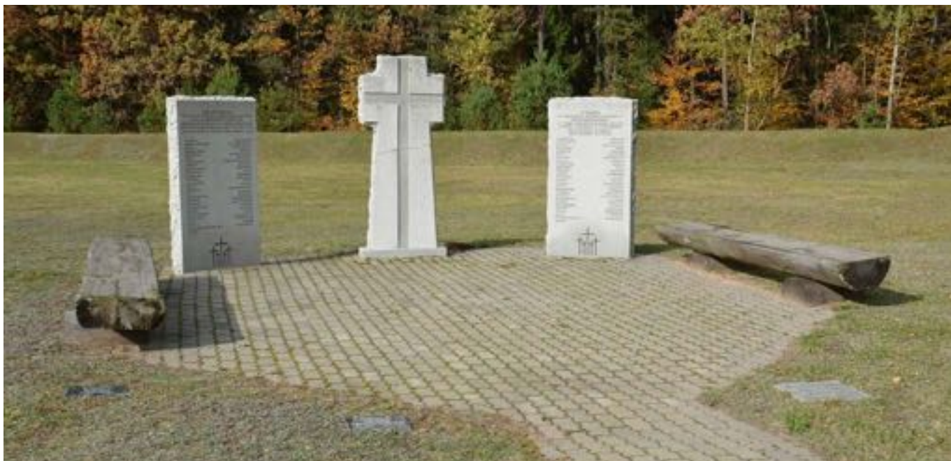
Na tomto válečném hřbitově spočívá 34 172 padlých vojáků.

Deutsche Kriegsgräberstätte Schtschatkowo