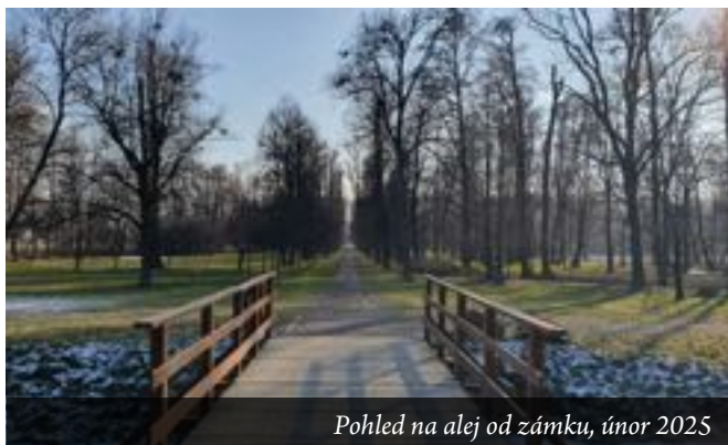
Pohled na alej od zámku, únor 2025