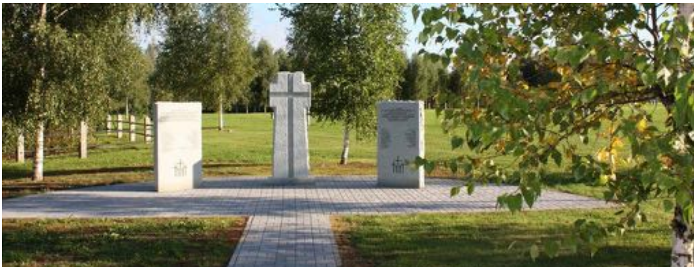
Na tomto válečném hřbitově spočívá 41 332 padlých vojáků.

Ržev měl během druhé světové války velký strategický význam díky své výhodné geografické dopravní poloze. Od zimy 1941 do jara 1943 bylo město dějištěm několika těžkých bitev, které jsou považovány za obzvláště brutální a krvavé.