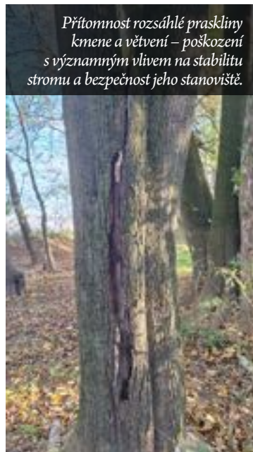
Přítomnost rozsáhlé praskliny kmene a větvení – poškození s významným vlivem na stabilitu stromu a bezpečnost jeho stanoviště.