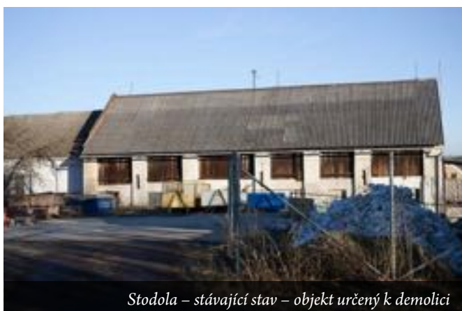
Stodola – stávající stav – objekt určený k demolici