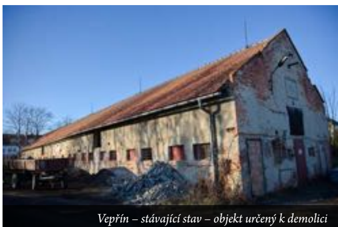
Vepřín – stávající stav – objekt určený k demolici

V rámci výstavby budou odstraněny nevyužívané objekty: bývalý vepřín, bývalá průmyslovka a stodola. Nový objekt bude umístěn přibližně na místě dnešního vepřína a svým tvarem bude připomínat tradiční vesnickou stodolu. Jeho výška nepřekročí hřeben stávající střechy.