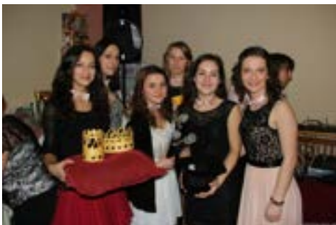
Hostesky, bez kterých by to nešlo. Uváděly přicházející na místa, asistovaly při soutěži a pomáhaly s obsluhou hostů.

V posledním občasníku jsme vám slíbili, že obecní bál na svatého Valentína pojmem jinak. Snad se nám povedlo povzbudit všechny, kteří nevěřili, že se dá nepohostinné prostředí přetvořit v kouzelný prostor. Doufáme, že si všichni přítomní na tanečním srdcovém bálu večer užili.