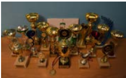
Čestné ceny za rok 2014