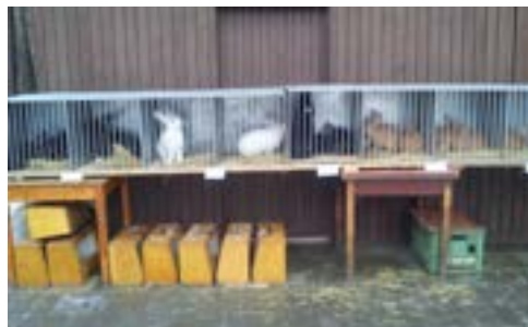
Lednové chovatelské trhy