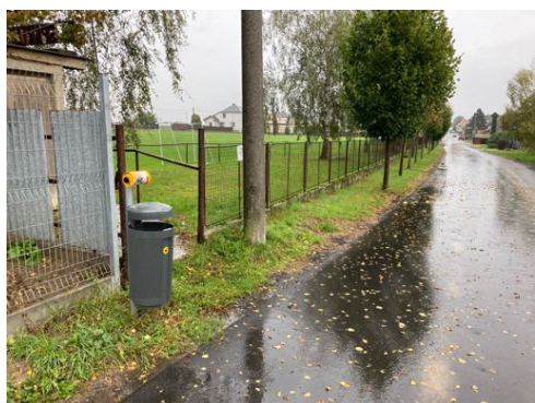
U fotbalového hřiště