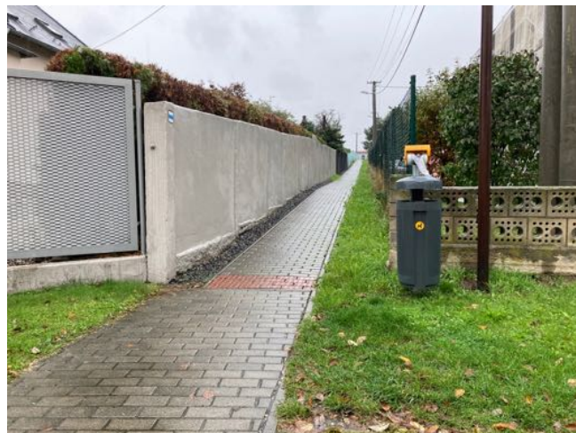
Ulička směr bývalý státní statek