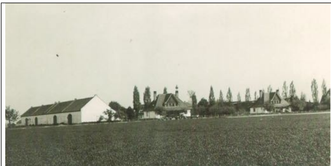
Rohov – bývalý státní statek

Velké podniky, jako továrny, doly, hutě, banky a velkostatky byly v roce 1945 košickým