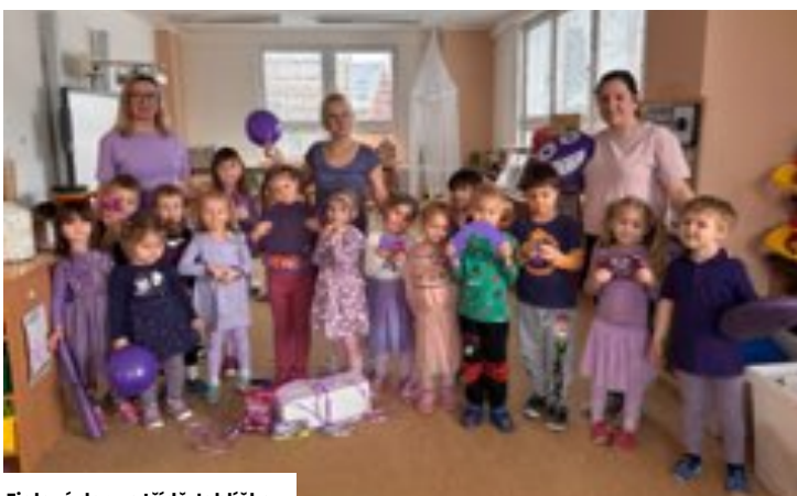
Fialový den ve třídě Jablíčko