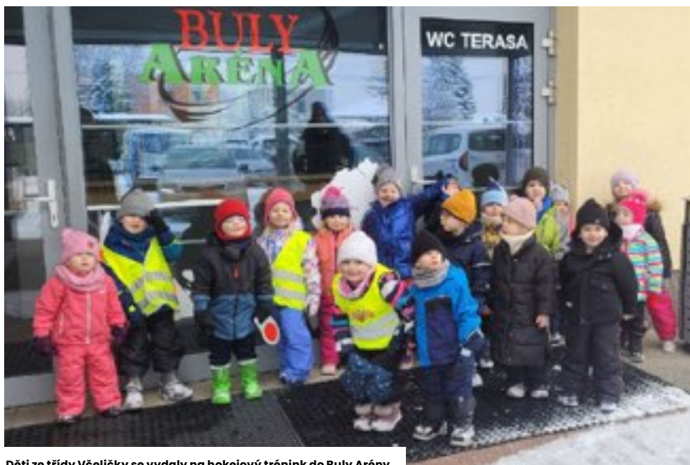
Děti ze třídy Včelíčky se vydaly na hokejový trénink do Buly Arény