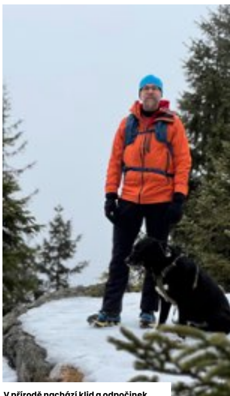
V přírodě nachází klid a odpočinek

vymýšlel technologii na speciální subtilní betonové konstrukce a následně jsme vyráběli designové doplňky, světla atd. Měli jsem s tím i úspěch, nicméně jsme oba dali přednost našim profesím. Taký rád relaxuju vařením a sportem. Jsem individualista, týmové sporty mě stresují, takže nehraju hokej ani fotbal. O to raději jezdím na kole, lyžích, snowboardu a chodím po horách. Ze všeho nejraději ale cestuju a rád poznávám neturistickým způsobem kulturu a přírodu celého světa. Baví mě nízkonákladové dobrodružné výlety.