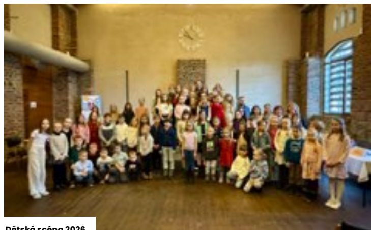
Dětská scéna 2026