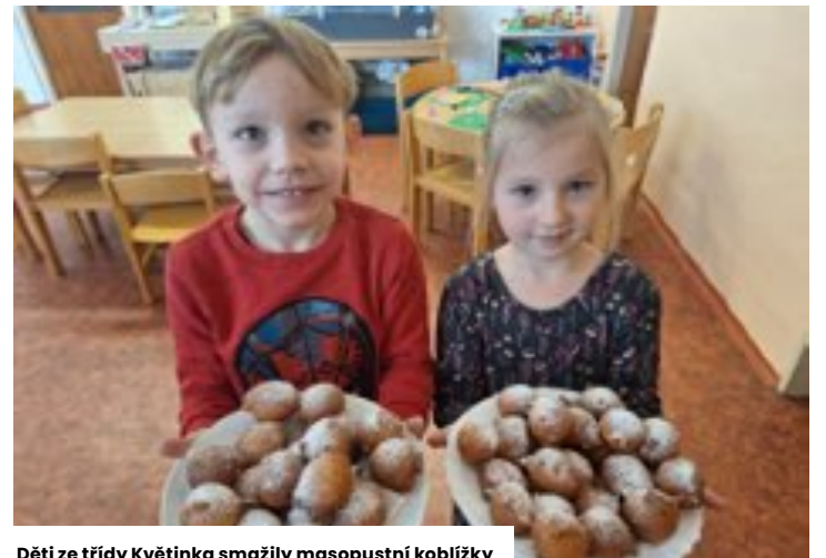
Děti ze třídy Květinka smažily masopustní koblížky