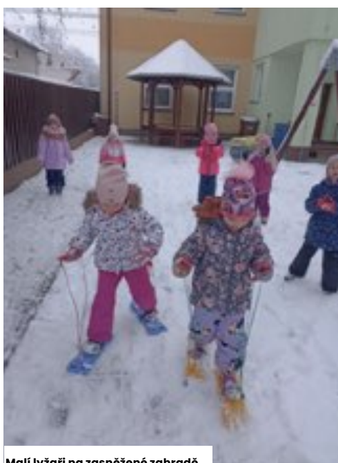
Malí lyžaři na zasněžené zahradě