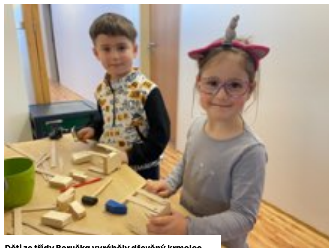
Děti ze třídy Beruška vyráběly dřevěný krmec