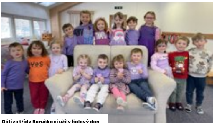
Děti ze třídy Beruška si užily fialový den