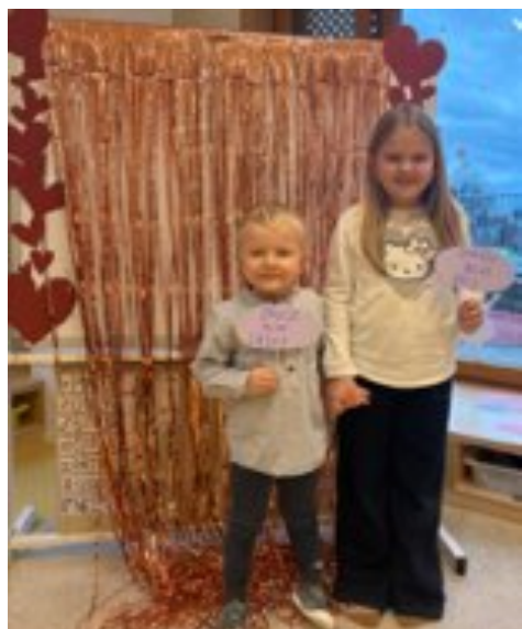
Valentýnské odpoledne ve třídě Kuřátko