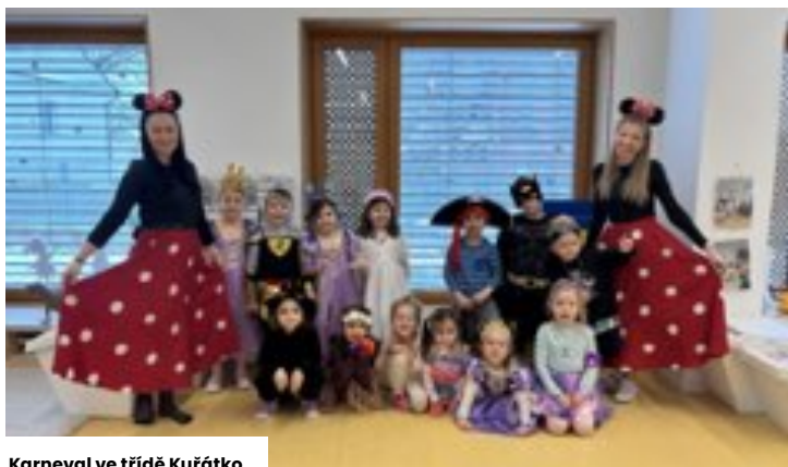
Karneval ve třídě Kuřátko