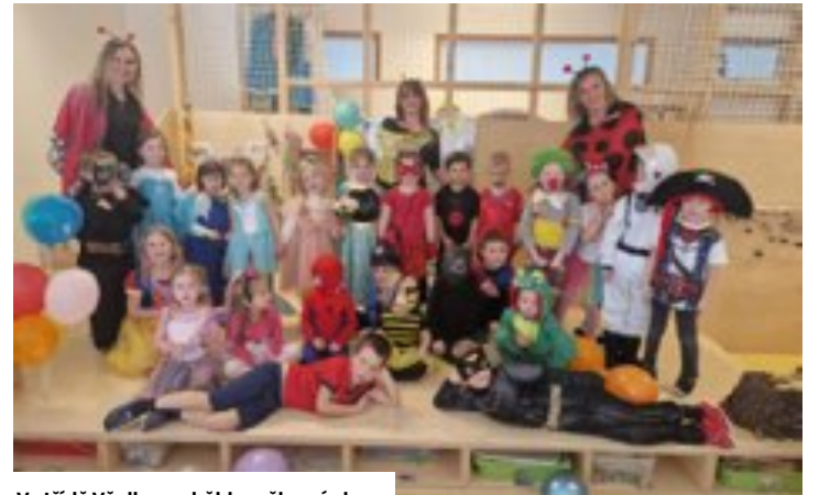
Ve třídě Včelka proběhl maškarní ples