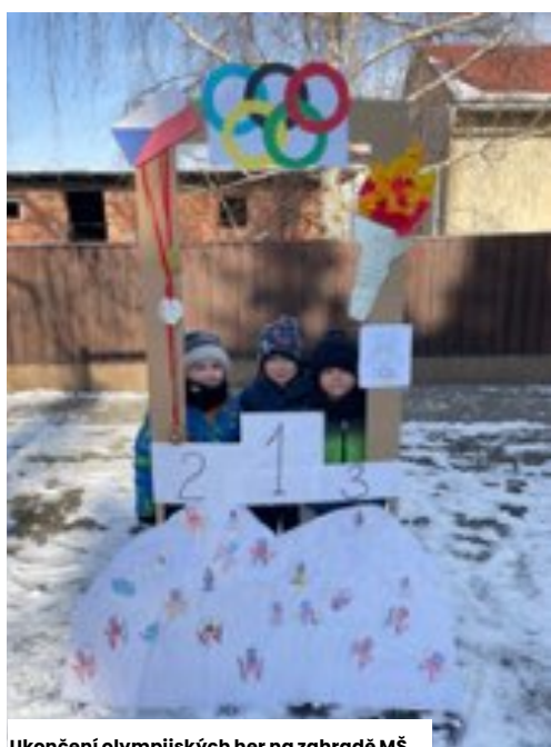
Ukončení olympijských her na zahradě MŠ