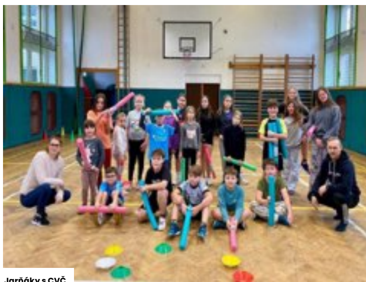
Jarňáky s CVČ