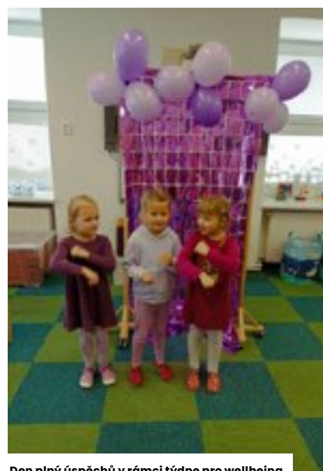
Den plný úspěchů v rámci týdne pro wellbeing