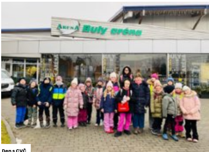
Den s CVČ