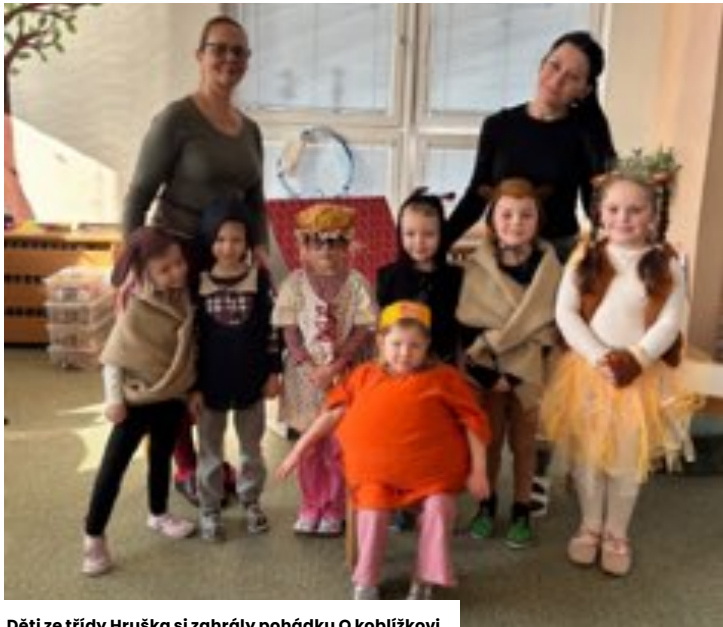
Děti ze třídy Hruška si zahrály pohádku O koblížkovi