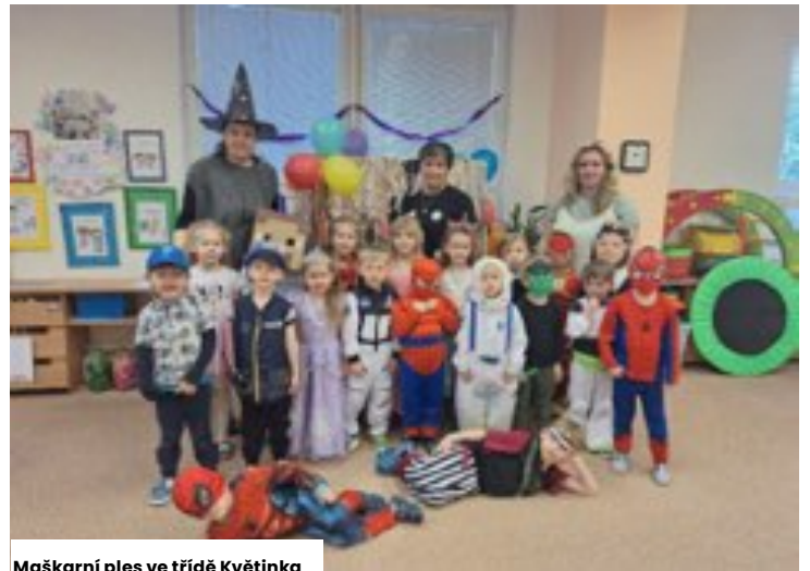
Maškarní ples ve třídě Květinka