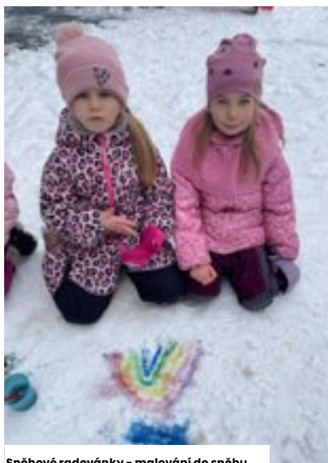
Sněhové radovánky - malování do sněhu