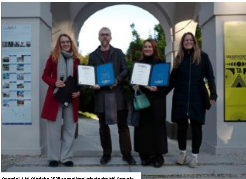
Ocenění J. M. Olbricha 2025 za realizaci přestavby MŠ Kravaře