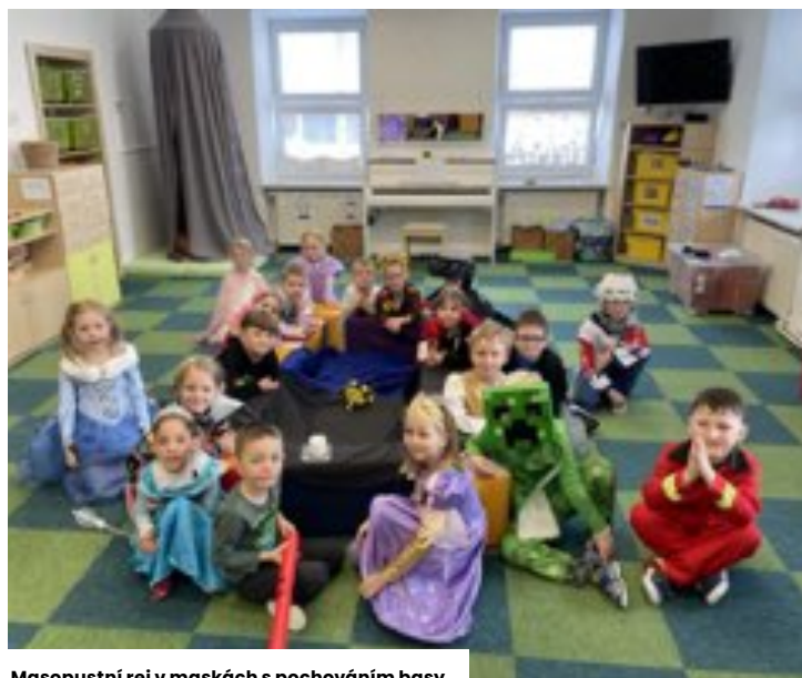
Masopustní rej v maskách s pochováním basy