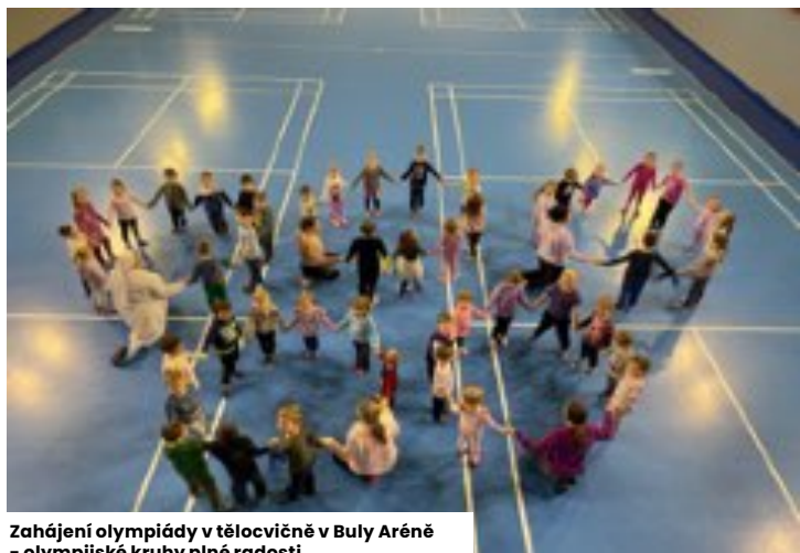
Zahájení olympiády v tělocvičně v Buly Aréně - olympijské kruhy plné radosti