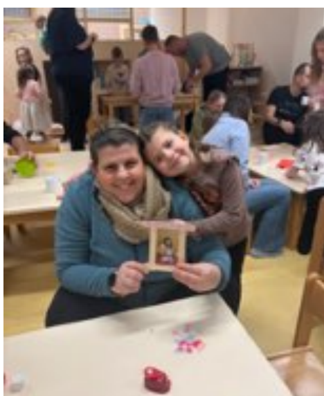
Valentýnské odpoledne ve třídě Kuřátko