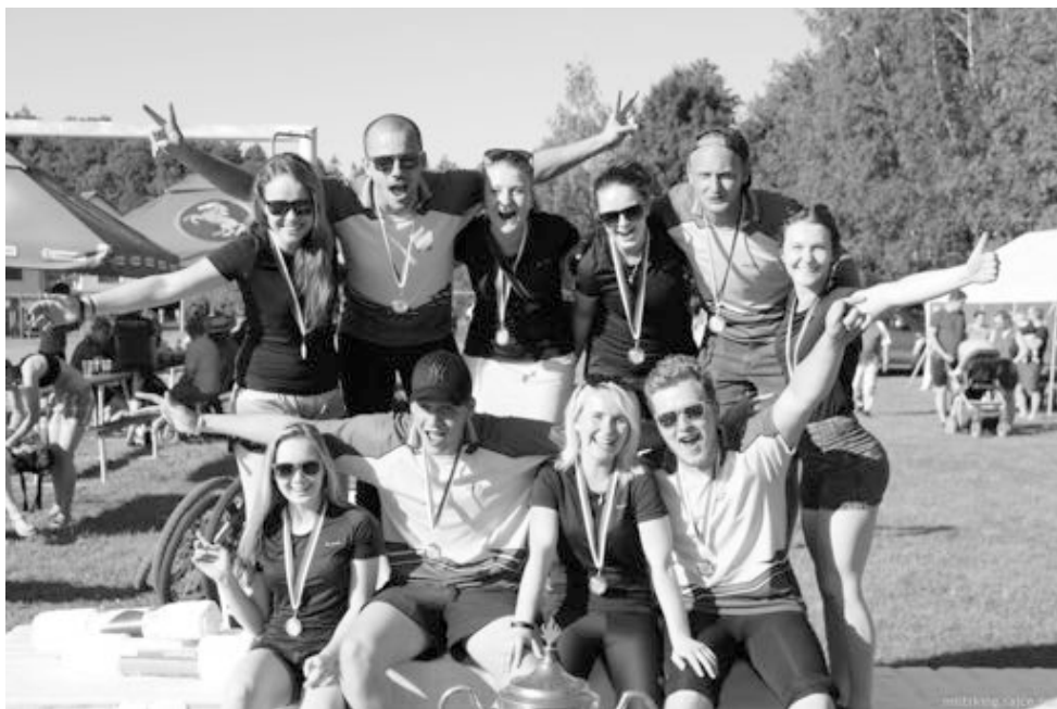
Zahajovací kolo MSP ve Svobodě oba týmy vyhrály.

Nezahálají ani naši muži a ženy, kterým začaly soutěže Moravskoslezského poháru a Extraligy ČR . Po prvních čtyřech kolech MSP vede mužský tým s 72 body tabulku průběžného pořadí a děvčata jsou s 36 body na průběžném pátém místě.