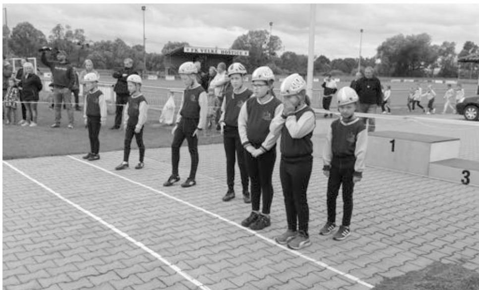
Mlaďší žáci před startem.