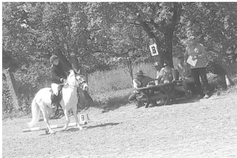
Agátka v akci.