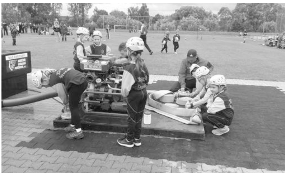
Piškoti se chystají ke svému druhému požárnímu útoku.