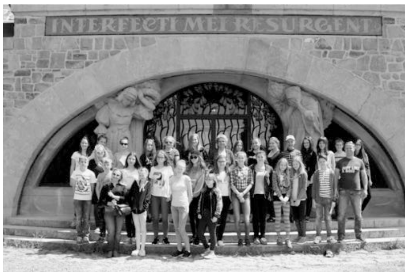
Před Mohylou míru.