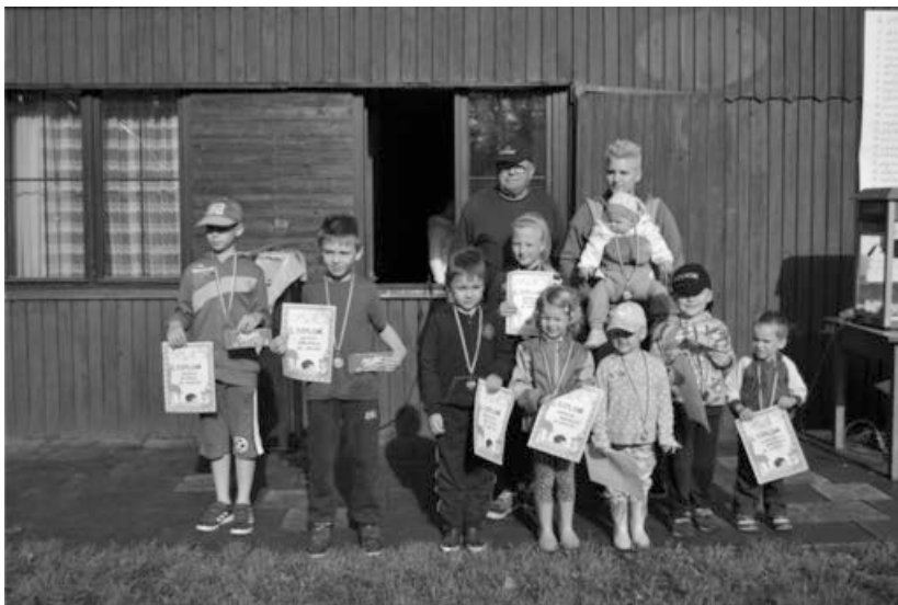
Děti na čtvrté dětské výstavě domácích mazlíčků.

Dne 10.6. 2017 proběhla v areálu Pekliska čtvrtá dětská výstava domácích mazlíčků . Této výstavě se zúčastnilo okolo patnácti dětí, které si přišly vystavit koťata, morčata, králíky, papoušky, slepice a holuby. Všechny děti byly oceněny a jsme rádi, že přišly i přes to, že v dopoledních hodinách nám počasí nepřálo. Je vidět, že dětem není chov zvířat cizí. Za odměnu byl pro ně připraven také skákací hrad, popcorn, tombola atd.