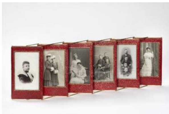
▲ Dekorativní rámeček se souborem šest kusů portrétních a skupinových rodinných fotografií hrabat Camilla a Marie Razumovských a jejich dětí