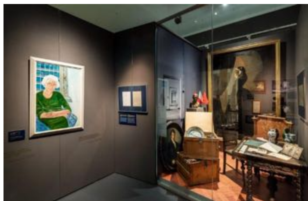
▲ Umělecké předměty z majetku Razumovských, původem ze zámků Dolní Životice a Horní Vikštejn, úřední dokumenty související s konfiskací rodového majetku