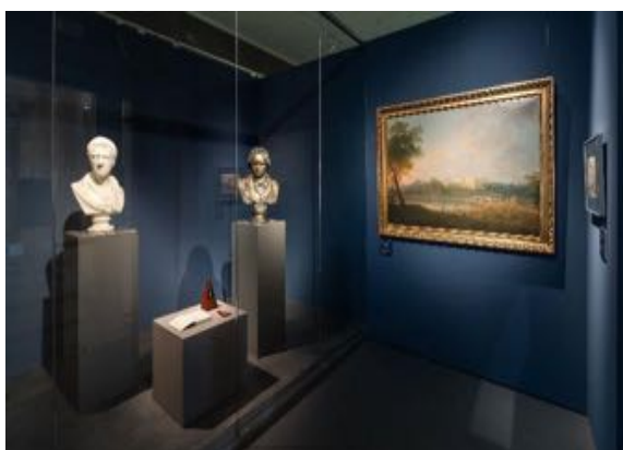
▲ Busta knížete Andreje Razumovského, busta Ludwiga Van Beethovena, veduta paláce knížete Andreje Razumovského ve Vídni