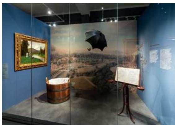
▲ Pohled proti toku řeky Moravice u Jánských Koupelí (olejomalba na plátně), replika lázeňského džberu užívaného k vodoléčbě, notový pult, slunečník (1990)